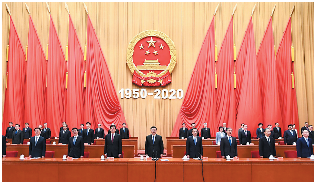
10月23日,纪念中国人民志愿军抗美援朝出国作战70周年大会在北京人民大会堂隆重举行。习近平、李克强、栗战书、汪洋、王沪宁、赵乐际、韩正、王岐山等出席大会。新华社记者 谢环驰摄