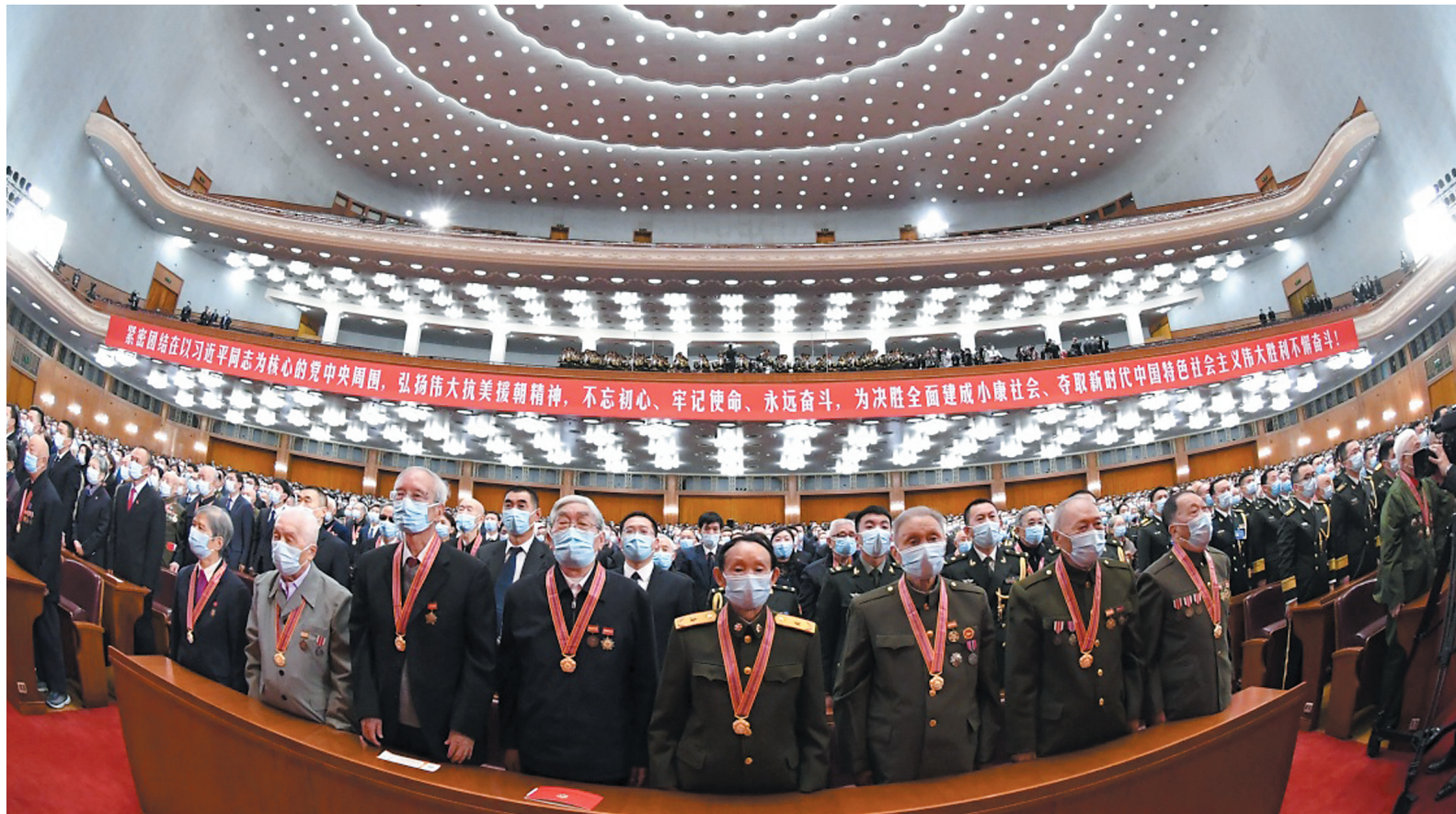
10月23日上午,纪念中国人民志愿军抗美援朝出国作战70周年大会在北京人民大会堂隆重举行。