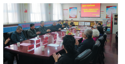
退休教师座谈会现场