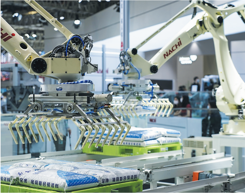
张开“双臂”拥抱未来

在市场环节,方案要求,加强进口冷链食品是否消毒的相关证明查验工作,防止未经过预防性全面消毒处理的进口冷链食品进入市场。进一步完善追溯管理,做到所有进入市场的进口冷链食品来源可查、去向可追。