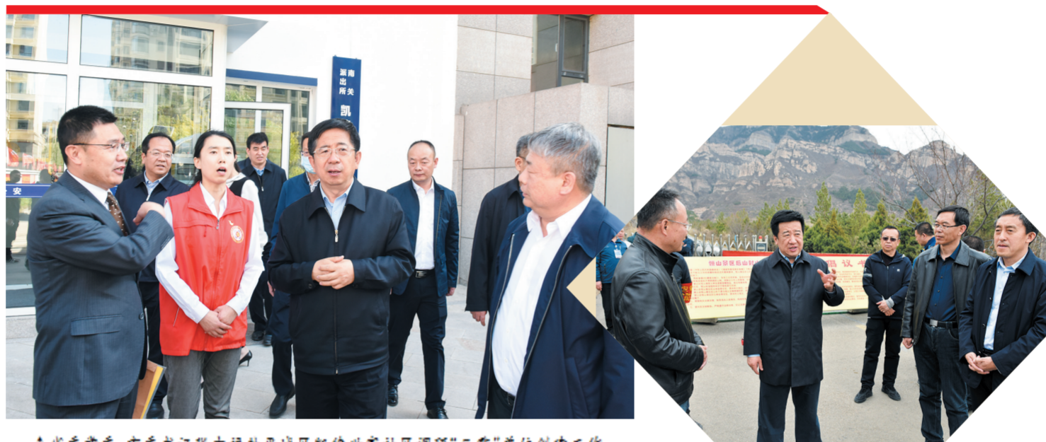
↑省委常委、市委书记张吉福赴平城区凯德世家社区调研“三零”单位创建工作。

——坚持深挖彻查，推动伞网清除。在扫黑除恶专项斗争中，我市始终把深挖“保护伞”作为扫黑除恶专项斗争的重中之重，与反腐败斗争、基层