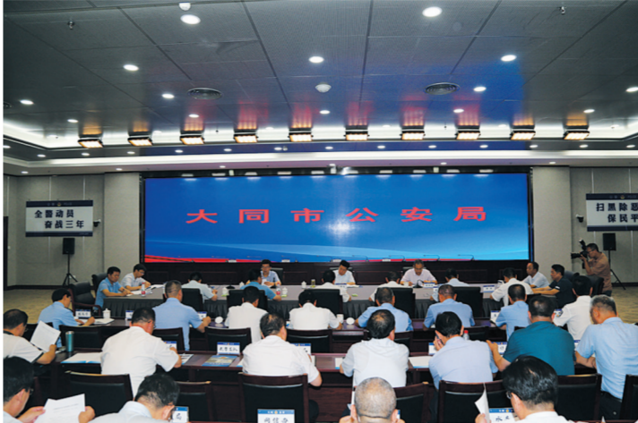
市委副书记、市长武宏文召开会议部署扫黑除恶专项斗争。