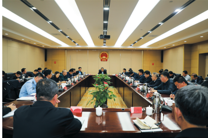
市委常委、政法委书记姚鸿波主持召开扫黑除恶专项斗争推进会。