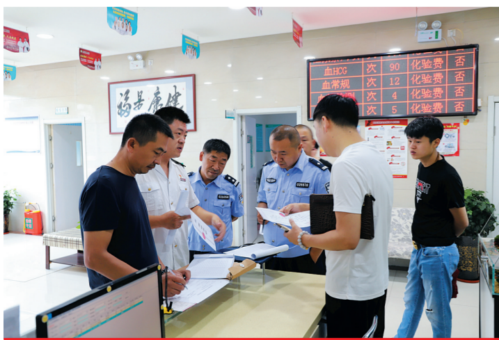
开展行业安全专项整治行动。

千淘万漉虽辛苦，吹尽狂沙始到金。全市政法系统将锚定扫黑除恶专项斗争阶段性目标，锐意进取，推动“三零”单位创建工作向更深迈进，积极推进社会治理现代化试点工作，致力打造更高水平社会治安防控体系，建设更高水平的平安大同。