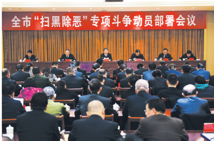
省委常委、市委书记张吉福出席全市扫黑除恶专项斗争动员部署会议。

翻开全市政法系统的“工作日志”，一项项“掷地有声”的工作诠释着奋斗的足迹，一组组数字感知着法治的温度。近年来，我市政法工作亮点纷呈，硕果累累：铲除黑恶势力，维护社会稳定，增强人民群众安全感；创建“三零”单位，建设和谐美好社会，增强人民群众幸福感；服务民营经济，保障高质量转型发展，增强人民群众获得感，为全市经济社会各项事业发展保驾护航。