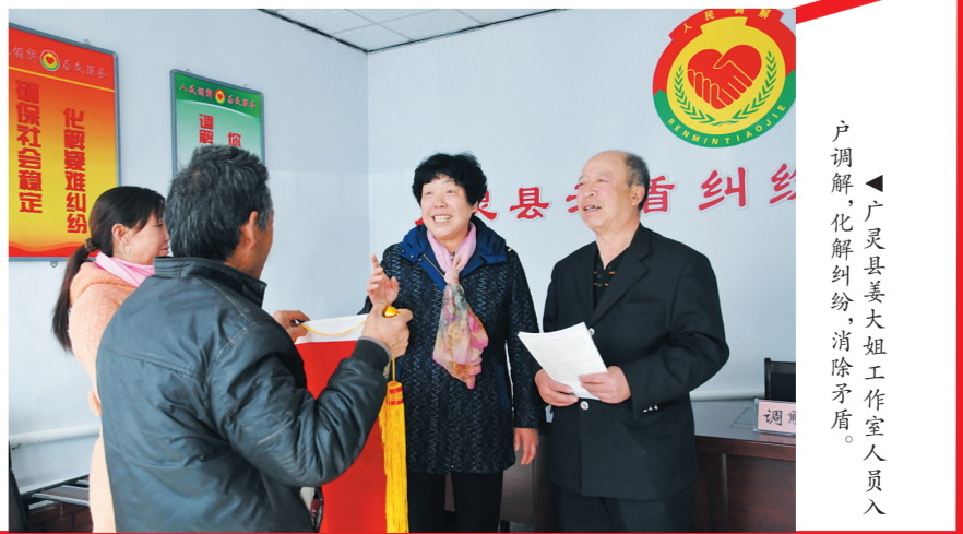
户调解化解纠纷消除矛盾。