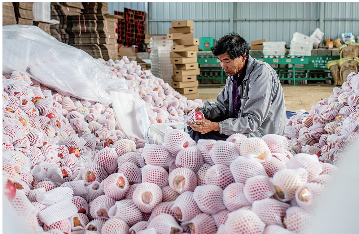
云南省会泽县娜姑镇牛泥塘村童盟种植专业合作社的农民在分拣石榴(2020年9月29日摄)。