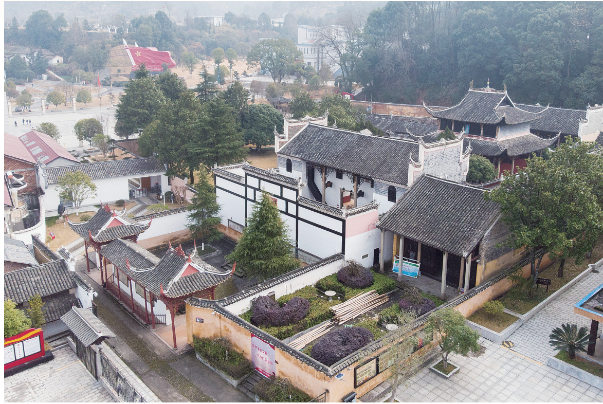
这是1月26日在湖南省浏阳市文家市镇拍摄的秋收起义文家市会师旧址(无人机照片)。