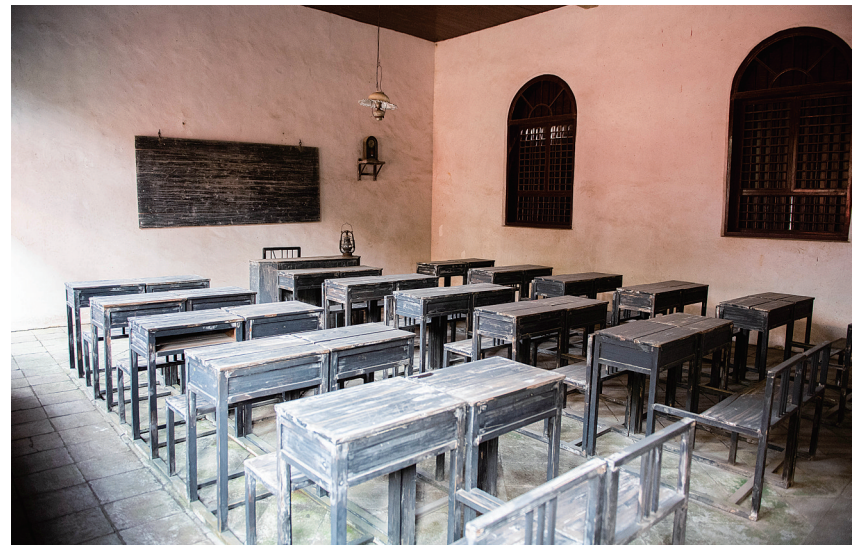
这是1月26日拍摄的秋收起义文家市会师旧址一角。