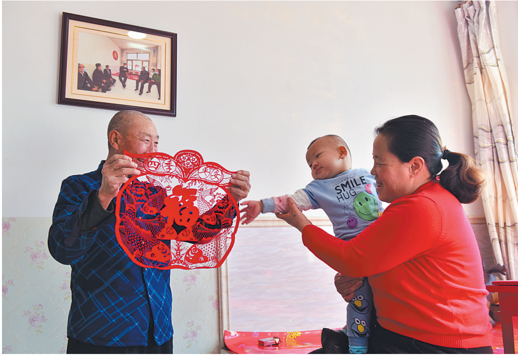
习近平总书记的亲切关怀,让白高山一家对新一年的美好生活充满了憧憬。

张灯结彩年味浓,欢声笑语迎新春。走过不平凡的一年,看,今天人们正以饱满的精神状态迎接2021年新春佳节的到来。年货市场琳琅满目,对联、窗花、灯笼,各式礼品以及蔬菜、肉类、糖果等应有尽有,到处都是市民采购年货忙碌的身影,红红火火,好不热闹!漫步街头,一排排彩灯流光溢彩,装点着美丽城市,增添着浓浓年味,人们结伴而行,赏灯、赏景,到处洋溢着欢乐的节日氛围。在习近平总书记去年5月视察过的云州区坊城新村,村民们不忘总书记关怀,辛勤劳作,积极奋进,他们笑脸盈盈,布置房间、贴窗花、挂灯笼、贴对联,欢欢喜喜迎新春。人们在忙碌的喜悦中,迎新春、话新春,寄托美好祝福,憧憬幸福生活,为新的一年蓄势,为新的一年赋能,踏着新春的脚步,继续奋进新的征程。