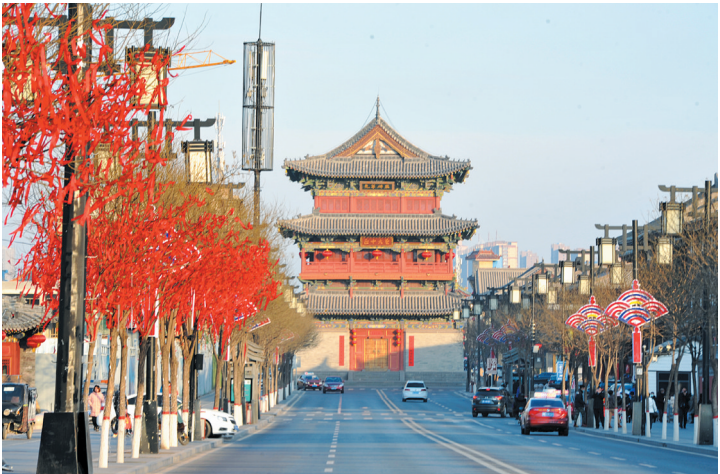
清远街道路两侧挂满了扇形彩灯和红红的绸带。