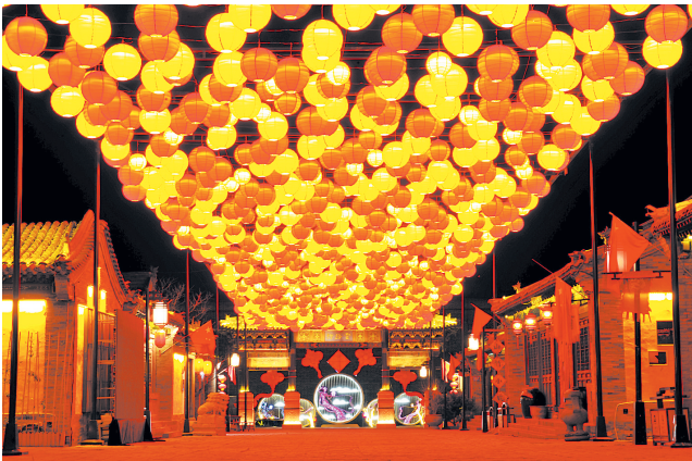
古城云路街,一排排红灯笼烘托出浓厚的节日氛围。