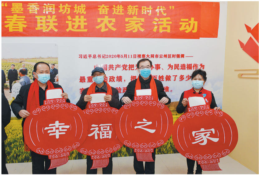
“幸福之家”新春送祝福。