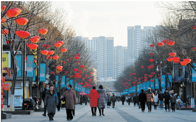
下寺坡街道路两侧挂满了红彤彤的灯笼及五彩缤纷的装饰品,整条街装扮得格外靓丽。