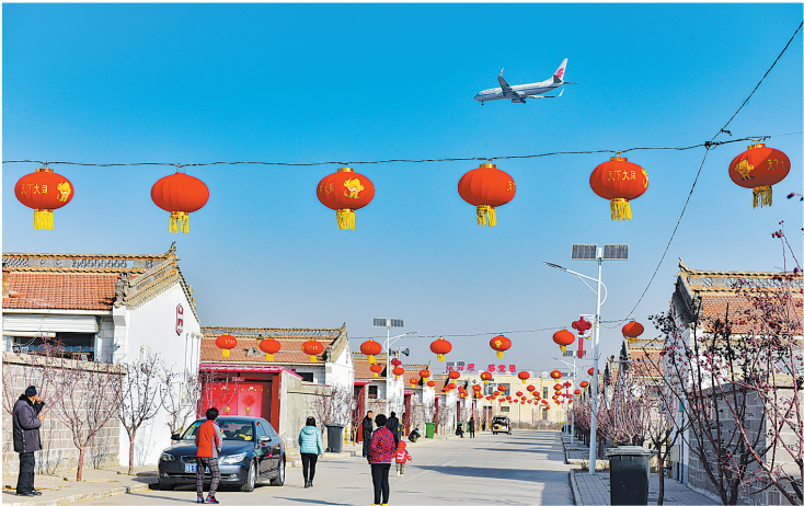
云州区坊城新村村容整洁,街道两侧灯笼高挂,到处洋溢着节日的氛围。