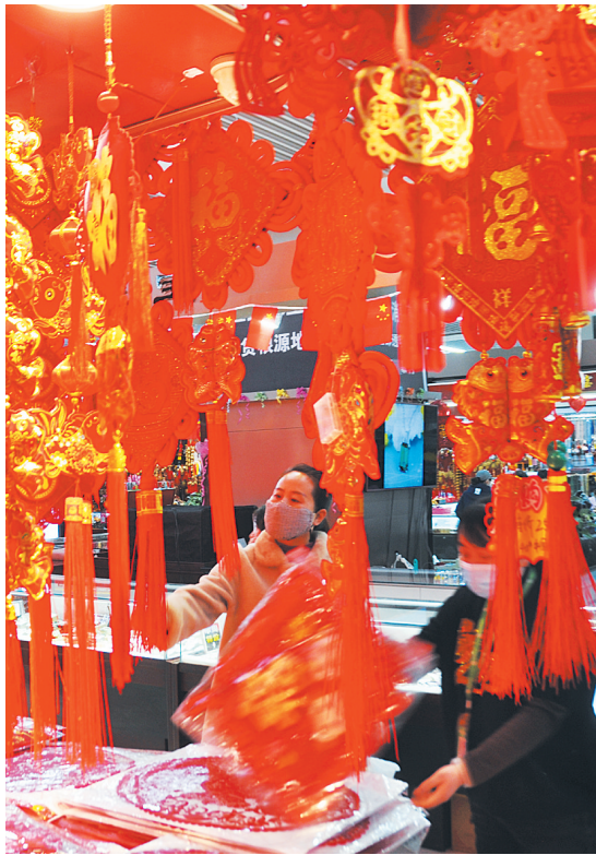
春节来临之际,市民纷纷来到市场挑选春联、福字、剪纸等。