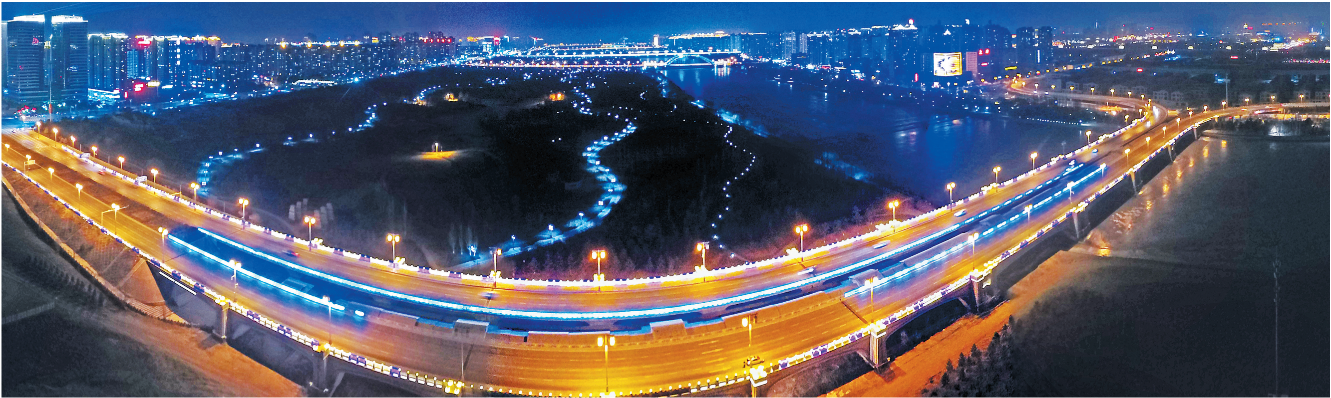
城市靓起来,年味儿浓起来!