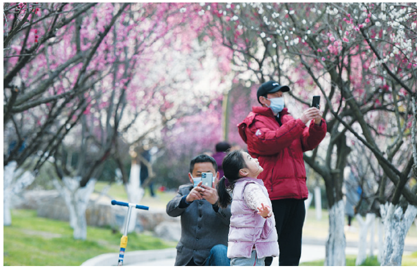
2月17日,游人在合肥市匡河河岸边的梅花丛里游玩。春节期间,安徽省合肥市匡河河岸边的梅花竞相绽放,吸引了众多市民和游客前来观赏。