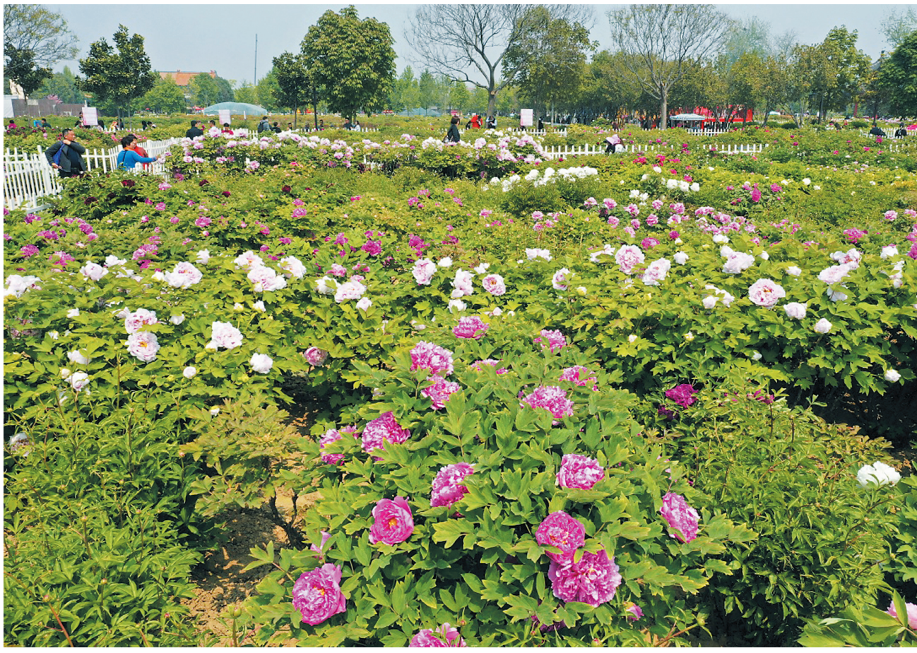
4月8日，游客在园内赏花（无人机照片）。近日，山东省菏泽市曹州牡丹园内的多品种牡丹竞相开放，正值第30届菏泽国际牡丹文化旅游节举行，吸引游客前来赏花。