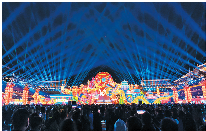
图为“春满古都·又见平城”开幕现场。