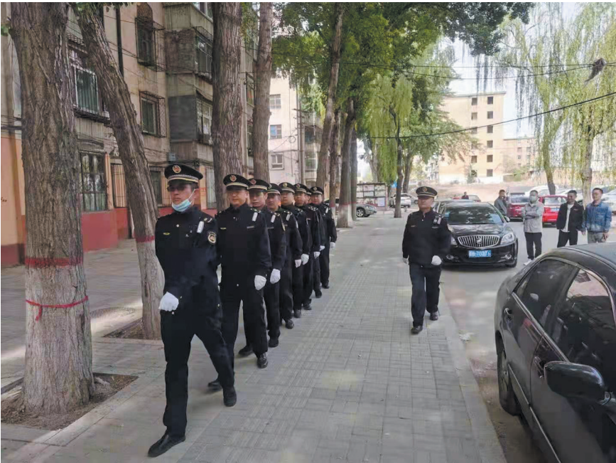
城管队员们正在步巡。

进一步提升城市功能品位,推进省城副中心城市核心区建设,打造市域治理示范区,平城区深入推进城市精细化管理,构建起政府主导、社会参与的“大城管”工作体系,推动全国文明城市创建再上新台阶,让广大群众共享城市精细化管理带来的美好成果。