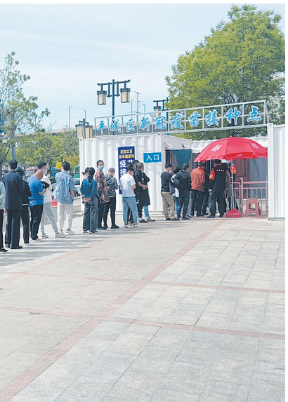
图为群众有序排队接种新冠疫苗。

整治市容市貌,平城区城管系统以“门前五包”为抓手,下发通告、发出倡议,各个城管队伍下沉街面,向商户认真讲解“门前五包”包含的“包净化、包绿化、包亮化、包美化、包秩序”等内容,与商户逐一签订“门前五包”责任书,并做好今年5月1日新修订施行的《大同市城市市容和环境卫生管理条例》的宣传,号召全体市民积极参与监督,发现违规者积极举报,对违规者依法予以处罚。下一步,对“门前五包”落实好或差的门店将分别通过多种形式进行通报,在全社会形成良好的争先创优氛围。 推进城市精细化管理,平城区18