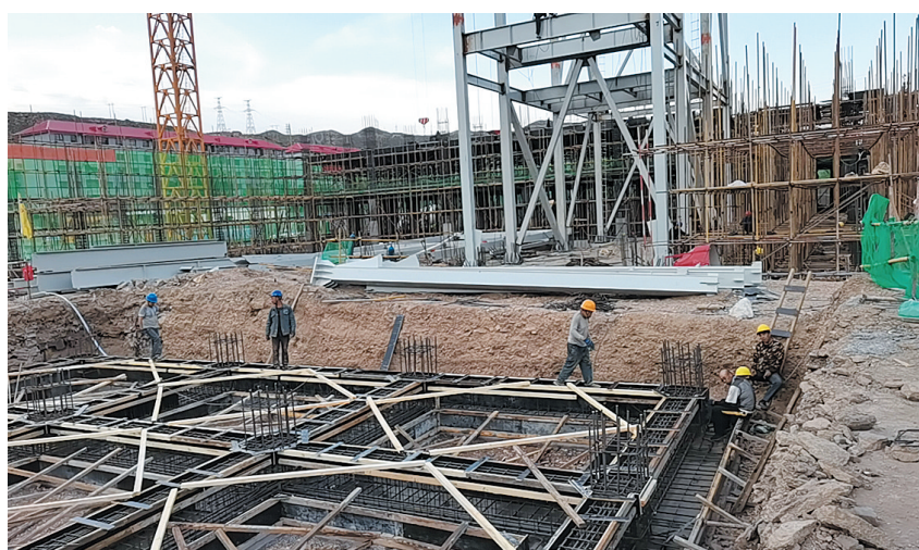
今年以来,晋能控股煤业集团四老沟矿践行“创新、绿色、卓越、高效”的企业理念,制定减污、降排、节能计划,高标准、严要求完成了各类违建拆除、“四通一平”、39个钻孔地勘等基础工作。3月5日,该矿开工建设了集中供热项目,项目建成后,可替代现有的48台燃煤锅炉、4台燃煤热风炉,有效解决冬季供暖期大气污染问题。图为该矿集中供热项目施工现场。

与此同时,该镇严格落实执行河长制,全镇3名镇级河长和15名村级河长严格履行汛期24小时应急值班制,11名河道巡查员昼夜巡查在3条主要河道的河岸上,沿河各村党支部书记对各村危房进行再摸排,对黄水河、黑水河、马槽沟三条主要河道实地开展防汛备汛检查,确保安全度汛。