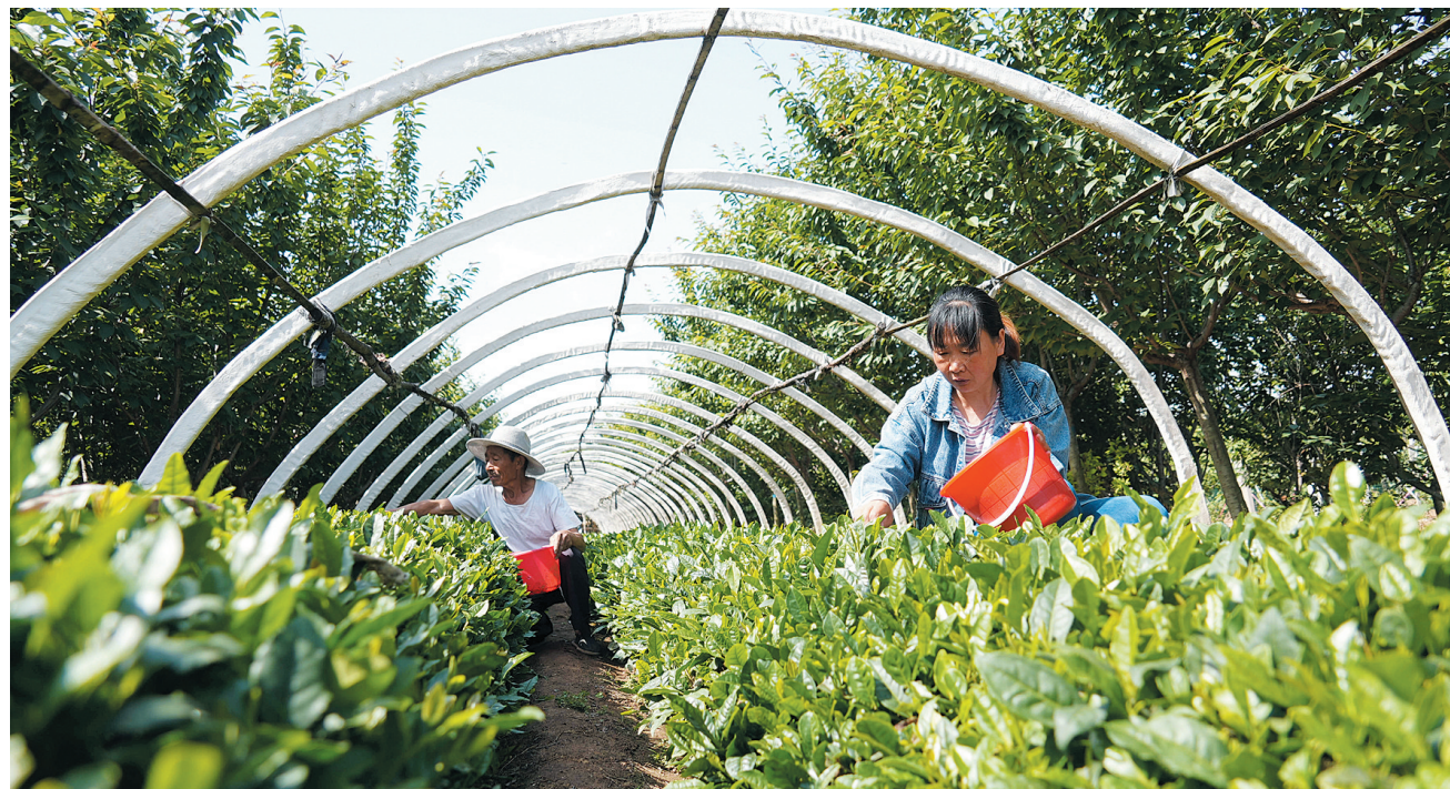
5月29日,村民在山东省泰安市泰山区省庄镇小津口村的茶园里采茶。近日,山东省泰安市泰山区省庄镇种植的茶叶迎来采摘季,茶农们忙着采茶制茶。茶产业是省庄镇北部山区农民的重要收入来源,全镇现有茶园面积8000余亩,年产值约2.3亿元。

(上接第一版)把胸怀“两个大局”作为谋划一切工作的出发点,做到在变局中保持定力,在全局中守好一域。要保持转型定力,立足率先蹚出转型发展新路,狠抓项目建设、科技创新、加快“六新”突破,在“率先”上抢先机、在“转型”上下苦功、在“蹚路”上勇探索。要锤炼过硬作风,拿出“逢山开路、遇水架桥”的闯劲和“滴水穿石、久久为功”的韧劲,积极投身转型发展主战场、城市建设第一线、乡村振兴最前沿,一张蓝图绘到底,一茬接着一茬干,善作善成,久久为功。要提高工作标杆,瞄准全省甚至全国先进,确立争创一流的目标,落实争创一流的措施,在区域竞争中争先进位。要守住安全底线,严格落实责任,紧盯重点领域,加强各类风险隐患的排查治理,为高质量发展提供坚实的安全保障。