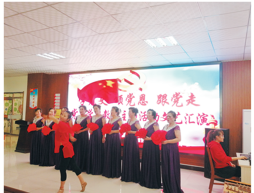
和泰社区庆祝建党100周年演出现场。