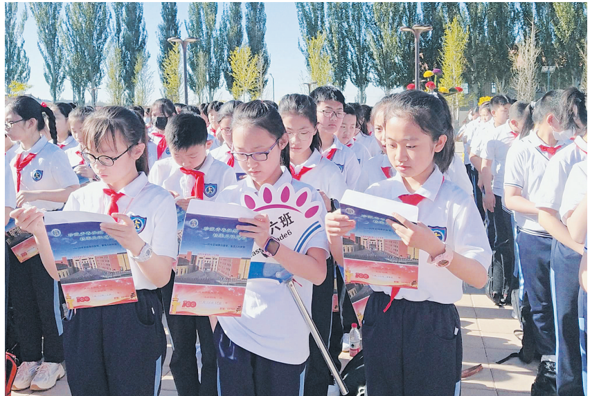
学生们将梦想放入档案袋中。