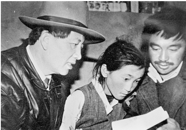
在西藏工作期间,孔繁森(左)在辅导藏族儿童读书(资料照片)。

6月的狮泉河烈士陵园,不时有人来到孔繁森烈士墓前,为他扫墓。 “一尘不染,两袖清风,视名利安危淡似狮泉河水;二离桑梓,独恋雪域,置民族团结重如冈底斯山。”墓两侧石碑上,镌刻着人们的崇敬。 孔繁森,1944年7月生,山东聊城人,生前两次进藏工作。1992年底被任命为阿里地委书记,工作期间跑遍了全地区106个乡中的98个,行程8万多公里,与藏族群众结下了深厚情谊。 长期在阿里地区工作的唐文明,对当年的一个场景仍然记忆犹新:寒冬时节,下乡途中,孔繁森看见路边有一个帐篷,走进后发现,一个单身母亲在里面抚养着4个孩子。孔繁森掏出身上仅有的80多元钱,留给了这个母亲,临走前还把大衣脱下给一个孩子穿上。 “孔书记当时就对我们讲,如果老百姓继续这样生活下去,我们上对不起天,下对不起地,中间对不起老百姓。”唐文明说。 平均海拔4500多米的阿里地区,气候恶劣,高寒缺氧,是西藏最艰苦的地区之一。长期贫穷的局面,致使当地卫生条件比较落后,医疗人员短缺。粗通医术的孔繁森,每次下乡都要提前买好药,装在随身携带的小药