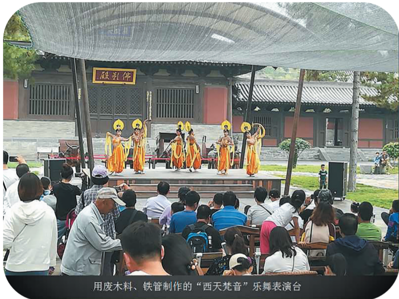
用废木料、铁管制作的“西天梵音”乐舞表演台

2018年12月25日,中国地质科学院地质研究所研究员孙爱萍等到云冈石窟考察,在石窟区发现距今一亿六千万年的古地震遗迹,系侏罗纪大地震导致的“喷砂冒水”现象产物,填补