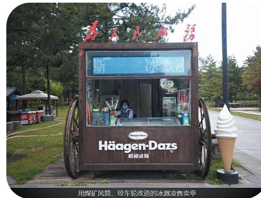
用煤矿风筒、绞车轮改造的冰激凌售卖亭