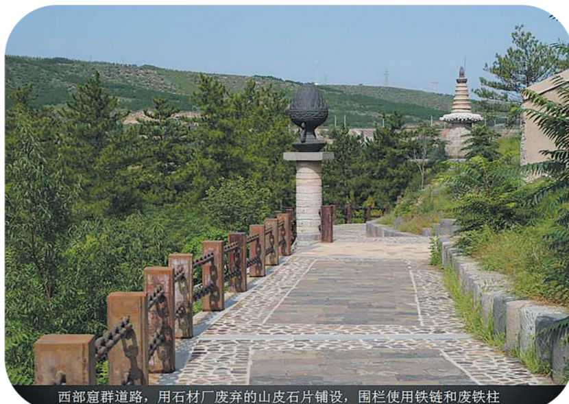
西部甬道,用石材厂废弃的山皮石片铺设,围栏使用铁链和废铁柱

完工以来,云冈研究院利用废旧工矿机具在景区建设了大大小小上百处景观设施。其中,坐落在东山东缘的永宁塔是最大的一项工程。