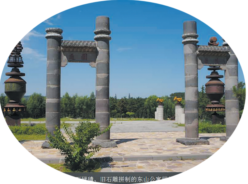
用废石、旧石雕拼制的东山公卿碑