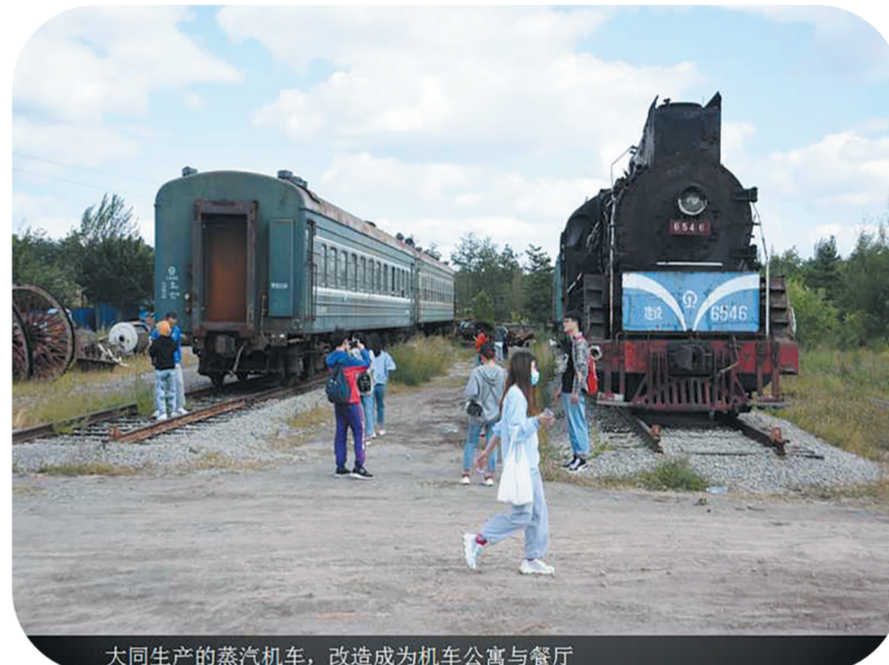
大同生产的蒸汽机车,改造成为机车公寓与餐厅