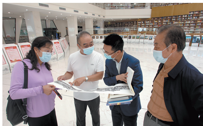
8月26日,市税务协作为市图书馆捐赠了《税收理论与实践》《影像税月》等税务类图书以及税务画册、杂志若干本,方便读者在图书馆了解更多的税收历史和税务知识。图为市税务协会工作人员向图书管理人员讲解《影像税月》中的内容。

截至目前,全县共完成“煤改电”2541户、“生物质+炉具”4234户,新增集中供热92万平方米8522户,县城“禁煤区”清洁取暖实现全覆盖,赢得城乡居民一致好评。