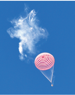
9月17日,神舟十二号载人飞船返回舱在东风着陆场成功着陆。