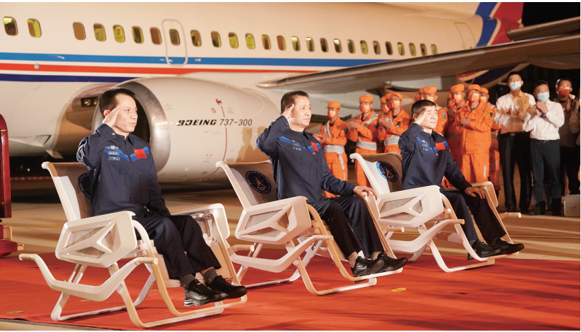
9月17日晚,聂海胜(中)、刘伯明(右)、汤洪波敬礼。

神舟十二号载人飞船于6月17日从酒泉卫星发射中心发射升空,随后与天和核心舱对接形成组合体,3名航天员进驻核心舱,进行了为期3个月的驻留,在轨飞行期间进行了2次航天员出舱活动,开展了一系列空间科学实验和技术试验,在轨验证了航天员长期驻留、再生生保、空间物资补给、出舱活动、舱外操作、在轨维修等空间站建造和运营关键技术。神舟十二号载人飞行任务的圆满成功,为后续空间站建造运营奠定了更加坚实的基础。