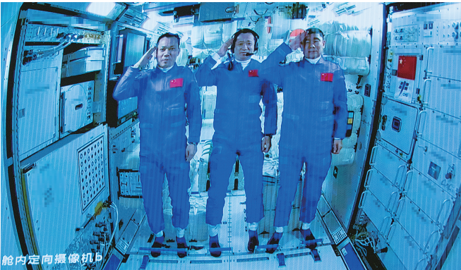
这是6月17日在北京航天飞行控制中心拍摄的进驻天和核心舱的航天员聂海胜、刘伯明、汤洪波向全国人民敬礼致意的画面。