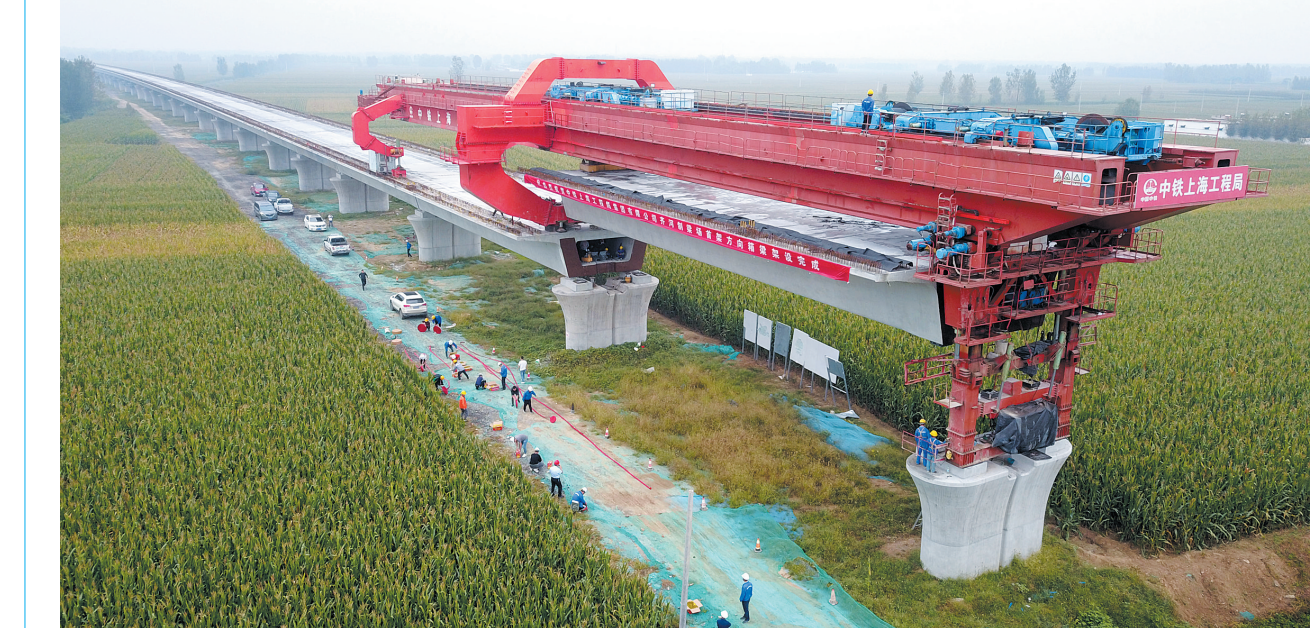
9月18日，国家重点建设项目郑（州）济（南）高铁山东段中铁路上海局标段首架方向箱梁架设完成。郑济铁路是国家“八纵八横”高铁网的重要组成部分。项目通车后，济南到郑州的通行时间将缩短至1.5小时。因为当日，在郑济高铁长清黄河特大桥项目段，中铁路上海局标段首架方向箱梁架设完成（无人机械臂）

活动期间，消费者通过支付宝搜索并领取消费券，同一消费者最多可领取到2张，其中零售券最多可领1张，餐饮券最多可领1张，可在活动指定的我市线下餐饮、零售实体店使用，活动细则详见支付宝消费券页面。