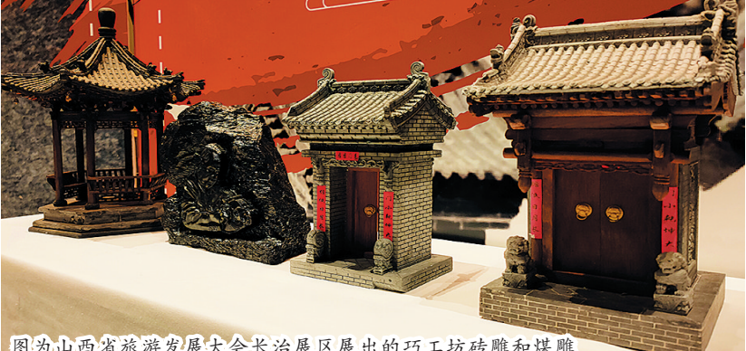
图为山西省旅游发展大会长治展区展出的巧工坊砖雕和煤雕