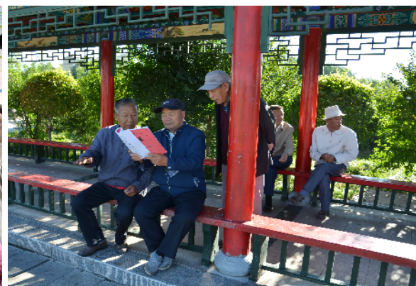
老年人公园里享受快乐时光