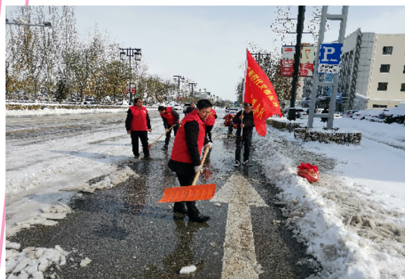
新时代文明实践志愿队清理积雪

大力推进新时代文明实践中心(所、站)建设不断提质，广灵县精心指导、融合推进、全面覆盖，目前已建立了1个新时代文明实践中心、8个新时代文明实践所、129个新时代文明实践站，中心组建了12支新时代文明实践志愿服务队，围绕文明出行、文明旅游、文明餐桌等十大文明活动载体，深入开展“做文明人、创文明城”专题培训和志愿服务，政策宣讲、文艺汇演、法律服务、环境治理、文明劝导等各类志愿服务活动累计达到3000余人次，在提升市民文明素质的同时，也大大增强了市民的城市归属感和对文明城市创建的认同感。