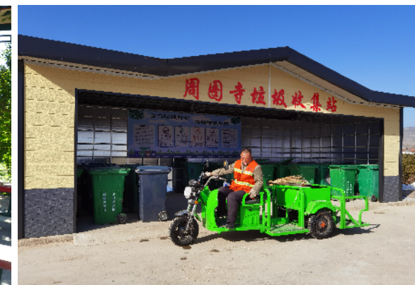
垃圾收集站令人耳目一新