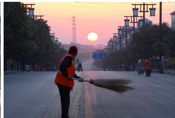
环卫工人迎着朝阳作业