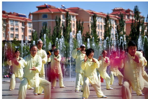
禾丰广场晨练一角