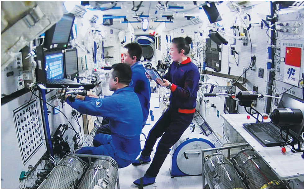
1月8日在北京航天飞行控制中心拍摄的神舟十三号航天员乘组进行手控遥操作天舟二号货运飞船与空间站组合体交会对接试验，航天员通过手控遥操作方式控制货运飞船。

停泊后，转入平移靠拢段，控制货运飞船与空间站组合体精准完成前向交会对接。 手控遥操作交会对接作为空间站与来访飞行器交会对接的重要模式，是无人来访飞行器自动交会对接的备份手段。此次试验，是首次由航天员在轨利用手控遥操作设备，控制货运飞船与空间站进行交会对接，初步验证了空间站与来访飞行器手控遥操作系统的功能、性能以及天地协同工作程序的合理性。