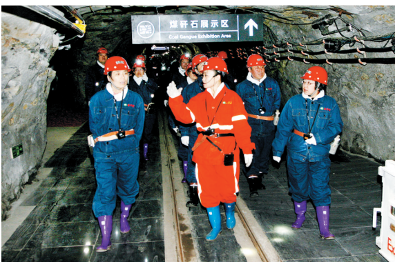
(本版图片均为资料照片)