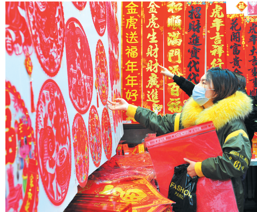
我市节日市场年味渐浓，年画、大红灯笼、福字、春联等早早摆上了市场，许多市民选购春联、灯笼等装饰品，准备把家里的年味装扮得更加浓厚。