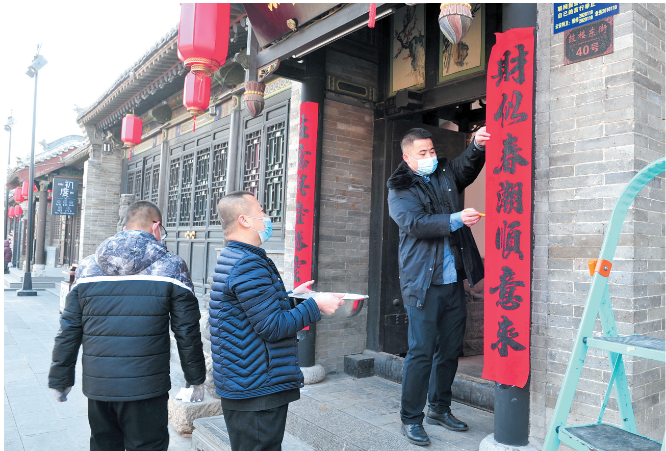
1月30日，鼓楼东街的居民、商户忙着贴对联、挂灯笼、贴窗花……春节临近，我市主要街道两旁已经张贴上红彤彤的春联、挂起了红红的灯笼，洋溢着浓浓的年味。图为鼓楼东街商户正在贴春联。

1月29日，市委宣传部领导班子党史学习教育专题民主生活会召开。会议强调，要旗帜鲜明讲政治，在对党绝对忠诚上作表率；坚持人民至上，在践行为民宗旨上作表率；推动宣传思想工作高质量发展，在勇于担当作为上作表率；着力营造良好政治生态，在全面从严治党上作表率。要持续强化统筹部署，打好宣传舆论主动仗；强化立德树