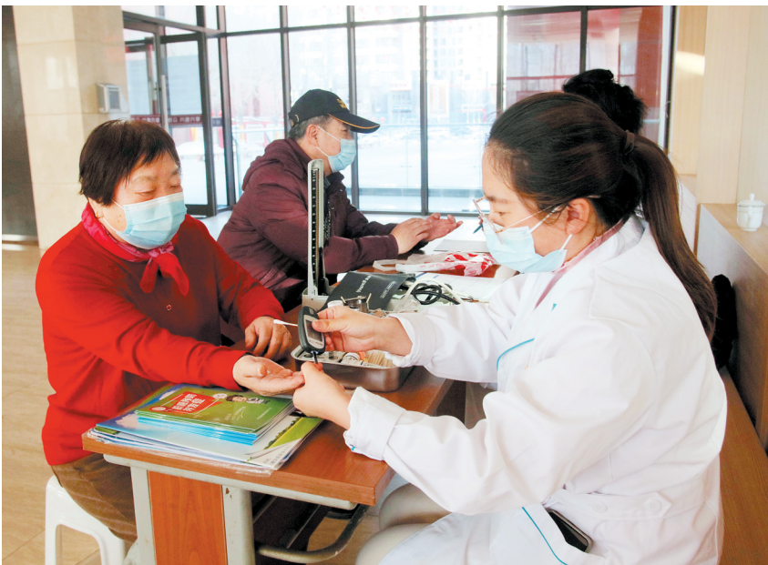
为积极传播糖尿病预防知识,引导广大市民科学降低发病风险,2月27日,平城区文瀾湖街道华北里社区联合市中医院在社区党群服务中心开展了义诊活动,免费为老年人测血压、测血糖,普及预防糖尿病等健康知识。图为医务人员正在为社区居民测量血糖。

库,制定详细的产业规划,推动大数据产业集聚性发展。 针对各企业反映的困难和问题,张强指出,市委市政府将进一步加大支持力度,继续做好补贴工作,及时协调解决企业人员办公、住宿、交通等问题。他要求各部门要积极协调高职院校,用活政策、用好资金,开展高管人才培养,建立政府、企业、高校人才培养联动机制,为数字产业跑出发展加速度进一步夯实人才根基。要常态化开展入企服务,及时帮助企业解决实际困难,助推企业健康发展,为我市全方位推动高质量发展注入新活力。