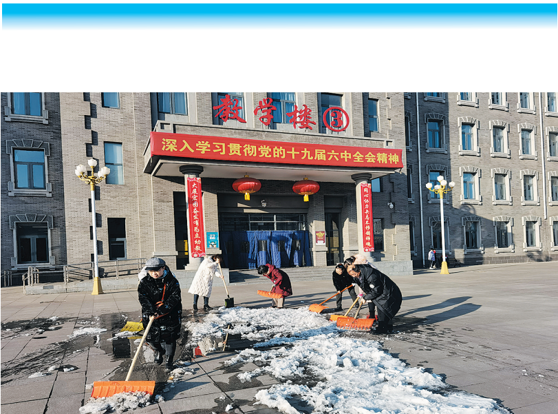
学校全体党员干部积极清扫积雪

会对建设新时代家庭具有重要意义。该校负责人表示,今后将持续加强“书香校园、书香家庭”的建设,推动阅读成为家庭成员的行为自觉,发挥读书在家庭教育中的独特作用,传播科学教育理念,弘扬家庭文明新风尚,推动社会主义核心价值观在家庭落地生根。