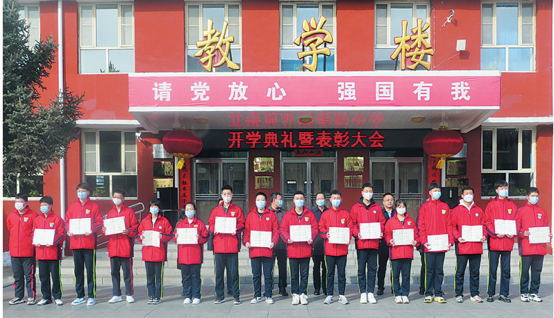
校领导为获奖学生颁奖

本报讯(记者 闫春平)怀着对新学期新生活的美好向往,近日,大同二职中全体师生齐聚教学楼前,举行2022年春季开学典礼暨表彰大会。