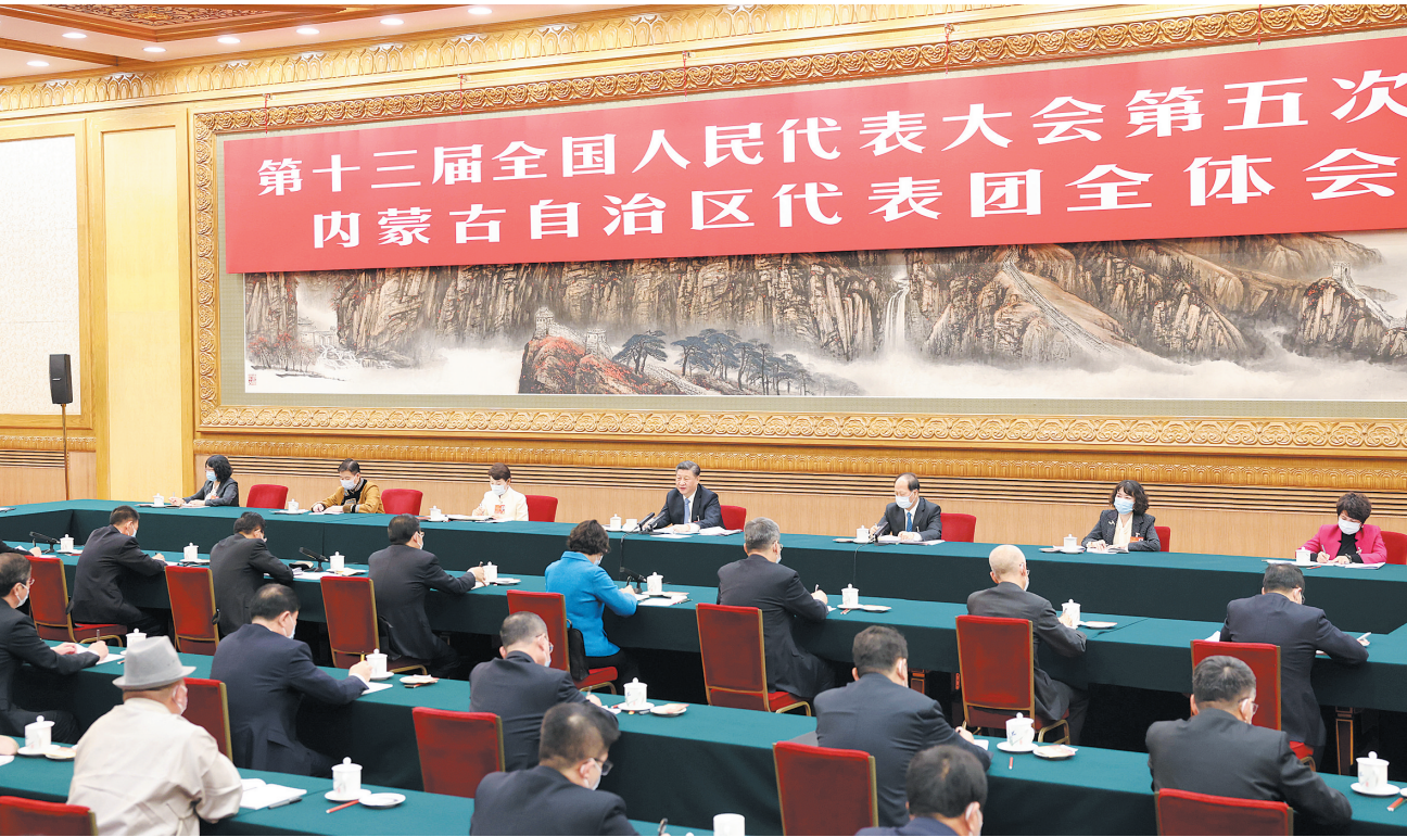
3月5日,中共中央总书记、国家主席、中央军委主席习近平参加十三届全国人大五次会议内蒙古代表团的审议。

新华社北京3月5日电 中共中央总书记、国家主席、中央军委主席习近平5日下午在参加他所在的十三届全国人大五次会议内蒙古代表团审议时强调,民族团结是我国各族人民的生命线,中华民族共同体意识是民族团结之本。要紧紧抓住铸牢中华民族共同体意识这条主线,深化民族团结进步教育,引导各族群众牢固树立休戚与共、荣辱与共、生死与共、命运与共的共同体理念,不断巩固中华民族共同体思想基础,促进各民族在中华民族大家庭中像石榴籽一样紧紧抱在一起,共同建设