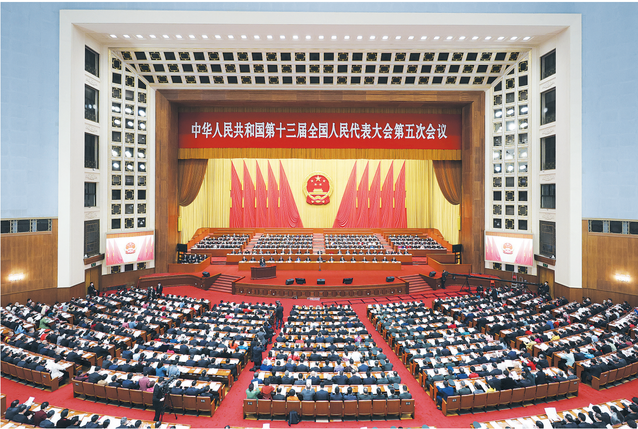
3月5日,十三届全国人民代表大会第五次会议在北京人民大会堂开幕。

听取关于地方组织法修正草案、关于十四届全国人大代表名额和选举问题的决定草案的说明等