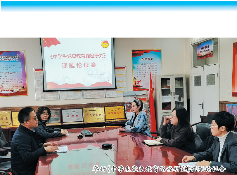
举行《中学生党史教育路径研究》课题论证会

感悟。 分享会上,各班同学踊跃参与,积极互动,介绍自己的阅读书目,分享自己的阅读方法,交流自己的读书心得,整个活动温馨而有序。 为开好此次分享会,师生们都做了充分的准备,他们不仅分享书籍,更重要的是交流思想。同学们纷纷表示,将以此次活动为契机,在今后的学习生活中,继续在书的海洋里畅游,以书籍陶冶性情,以书香涵养师生气质,以书籍提升专业素养。