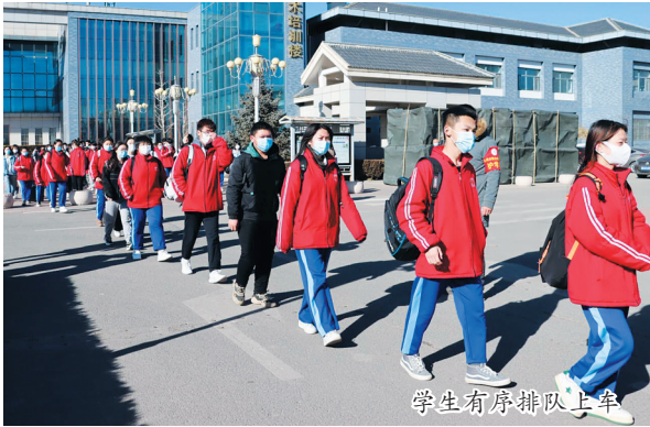
学生有序排队上车

为加强学生乘坐公共交通工具期间的疫情防控,该校还提前对此3条“定制公交”车辆的营运秩序、服务卫生、技术状况进行了全方位的综合性检查,为学生在疫情期间的安全出行保驾护航。