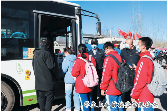
学生上车前接受常规检查

一切为了学生,为了学生的一切。疫情防控期间,该校把学生生命安全和身体健康放在首要位置,