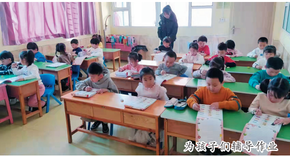
为孩子做辅导作业

了岗前培训,加强实习实训指导,增强实习安全意识,为实习生走向工作岗位做好铺垫,打下基础。同时,该校为参加实习的学生购买保险,与实习单位签订实习责任书,保障学生的合法权益