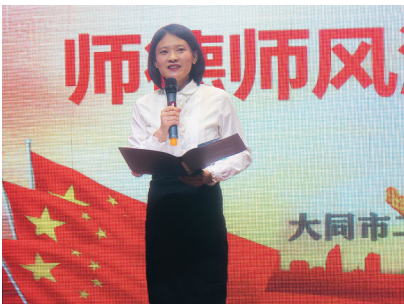
举办青年教师师德师风演讲大赛