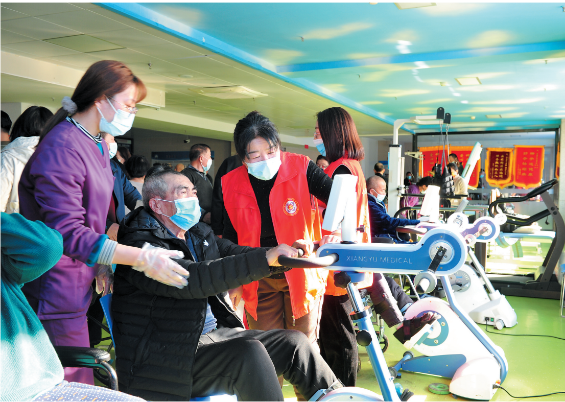
日前，平城区迎宾街道绿园社区党支部结合“我为群众办实事”实践活动，联合医疗机构开展“关爱居民健康开启幸福生活”活动，向辖区居民普及科学的健康知识，倡导居民养成良好的生活习惯，提高居民健康意识和自我保护能力。图为社区工作人员指导居民做康复训练。