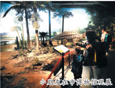
小朋友在市博物馆观展