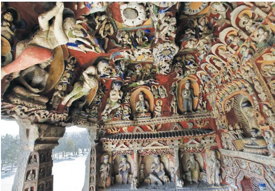
云冈音乐洞窟内景

垂挂，没有倚在腿上。 六、触地印。 右手覆于右膝，手指头触地，以示降伏魔众之意。佛陀为了众生，牺牲自己，大地可以证知，因为这些都是在大地上做的事。 云冈石窟佛像作触地手印者虽然不是很突出，但却表现了足够的佛教意义。第10窟后室南壁明窗与窟门间坐佛像列龕上层东起第5龕，佛像右手臂举起至胸，五指伸展，手掌侧向前方的无畏手印，配以左手下垂呈跏趺姿势的左小腿前，食指伸直指地的触地印。 七、说法印。 说法印是佛陀说法时的惯用手印，它的形态是左手横放在左