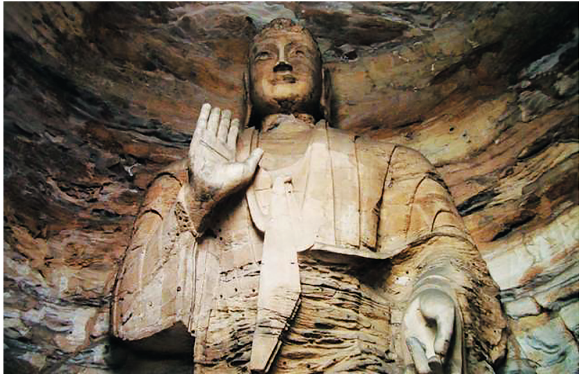
云冈第16窟主尊结智吉祥印