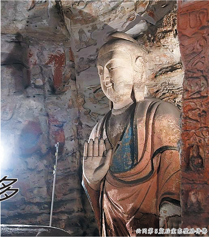
云冈第5窟后室东壁胁侍佛