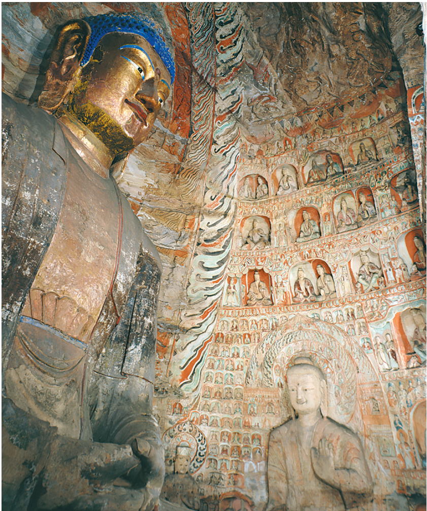
云冈第5窟后室内景

刻印象。 南壁窟门与明窗间雕列龕两排，上排为八个圆拱龕，下排为八个盞形帷幕龕，龕内均置坐佛，齐整有序、威严肃穆。南壁上层东西两侧，各雕有高浮雕大象驮负须弥座五层瓦顶出檐佛塔，设计精巧、呼之欲出，是云冈石窟佛塔雕刻的精品，也是中国传统建筑艺术与印度佛教艺术相结合的典范。西壁第五层北侧面圆拱龕内，是一尊交脚著菩萨装的佛像，左手抚膝，作降魔印，右手伸展于右胸，作无畏印。佛像肉髻高耸，面相饱满方圆，身姿挺拔，上身交叉帔帛之两侧上翘于双臂，下身系长裙，跣脚坐狮子座上。菩萨装佛像，在云冈仅此一例，这是北魏当年盛行的弥勒信仰在云冈石窟中的一种新表现。 历史上，第5窟曾多次修缮。1974年至1976年的“三年保护工程”是云冈石窟第一次大规模维修。当时，大批洞窟及雕刻濒临崩塌，洞窟稳定性很差，维修保护迫在眉睫，其中包括第5窟。2015年6月29日，第5窟内一个佛龕顶部岩石突然掉落。云冈研究院立即封闭洞窟，开展病害调查。调查中发现大量起翘、风化裂隙等小尺度病害。为防止此类事件再次发生，云冈石窟日常保养工作成为常态。