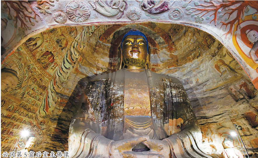
云冈第5窟后室主佛像