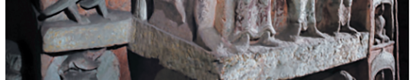
第6窟后室中心塔柱“树神”现身

云冈石窟中树的形状与高句丽墓群壁画中的树木形状有相近之处,云冈石窟中树下思维中的树木与高句丽墓群壁画中的树木有类同之处。而第5窟门拱两侧禅定佛上的大树的形状与高句丽墓群壁画有相近之处。《魏书》记载,太延元年(435),“丙午,高丽、新罗遣使朝贡”。此后太延年间(435—439)、献文帝时期(466—470)、孝文帝时期(471—499),高句丽多次向北魏遣使,可见云冈石窟中的树木还展现了高句丽与北魏的友好交往。