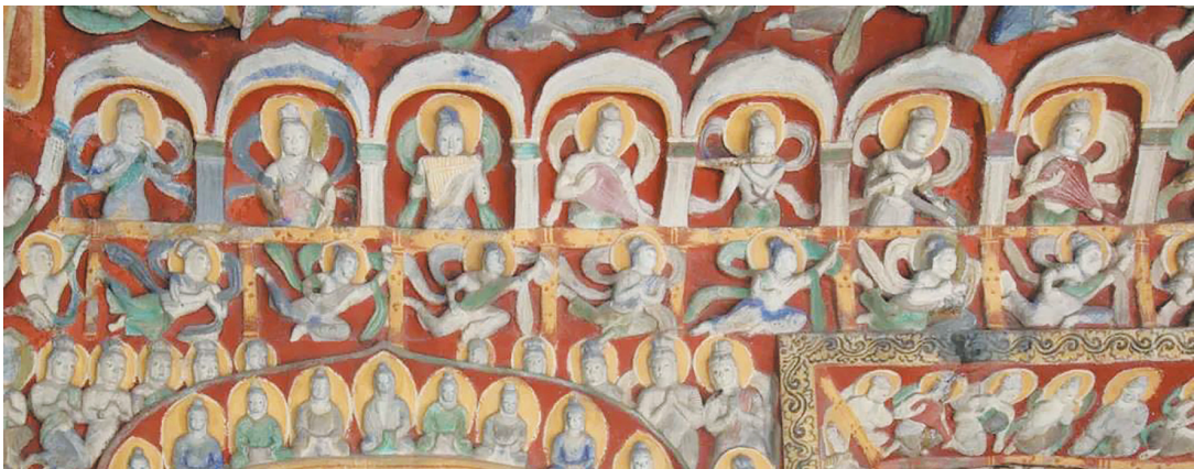
云冈音乐洞窟内景