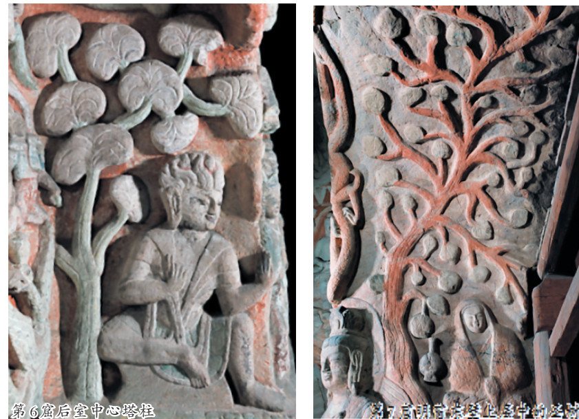
第6窟后室中心塔柱