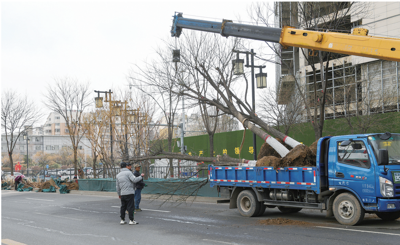
又到一年植树季，平城区开始在各主干道补绿增绿。图为昨日在永泰南路，该区园林部门工作人员在绿化隔离带种植绿篱树木，并搭建暖阳棚保证新种树木成活。

向，着力破解支点支撑不够难题；坚持目标导向，着力破解亮点打造不够难题，努力推动试点工作取得突破性进展。要进一步压实工作责任，强化支撑保障，严格督导考评，勇于开拓、善于创新、攻坚克难，切实提升市域社会治理现代化水平，以决战决胜之势冲刺试点建设，确保圆满完成试点任务，努力建设更高水平平安大同，为我市全方位推动高质量发展提供坚强保障。 市委政法委班子成员，承担市域社会治理现代化试点工作的市直部门负责人同志，各县区委政法委书记参加了会议。