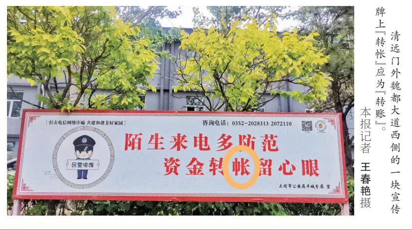
清远门外魏都大道西侧的一块宣传牌上“转账”应为“转帐”。