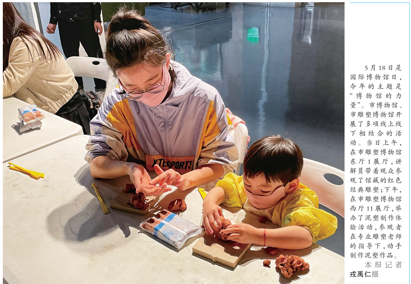
5月18日是国际博物馆日，今年的主题是“博物馆的力量”。市博物馆、市雕塑博物馆开展了多项线上线下相结合的活动。当日上午，在市雕塑博物馆东厅1展厅，讲解员带着观众参观了馆藏的红色经典雕塑；下午，在市雕塑博物馆西厅11展厅，举办了泥塑制作体验活动，参观者在专业雕塑老师的指导下，动手制作泥塑作品。

据了解，今年全民营养周的宣传主题是“会烹会选 会看标签”，“5·20”中国学生营养日的宣传主题是“知营养 会运动 防肥胖 促健康”。为带动全社会共同参与，提高大众参与程度，培育健康烹饪意识和习惯，树立健康饮食新风，市卫生健康综合行政执法队按照市卫健委统一安排，根据疫情防控要求，积极创新方式方法，通过大同卫生监督邮箱、公共场所微信群、学校微信群、牛角坝帮扶村牛头山和大小长岭合作社微信群等推送《中国居民膳食指南》《国民营养计划（2017-2030年）》《儿童青少年肥胖防控实施方案》《学校食品安全与营养健康管理规定》等，向所辖公共场所、供水单位、学校、医疗机构、厂矿企业、帮扶村等赠送卫生监督健康电子大礼包。同时，通过开展丰富多彩、形式多样、群众互动性强的线上线下系列宣传活动，向市民普及营养健康知识。