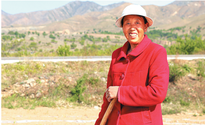
阳高县乳头山村位于长城脚下，村子依山而建。村前的田间常能看到一位身穿红色衣服的老人，老人六十多岁，身体结实，她经常和老伴一起出地干活。她高兴地告诉我：“我在乳头山住了一辈子，现在生活好多了，吃穿不愁，这样的日子真好！”瞧，她笑得多灿烂！