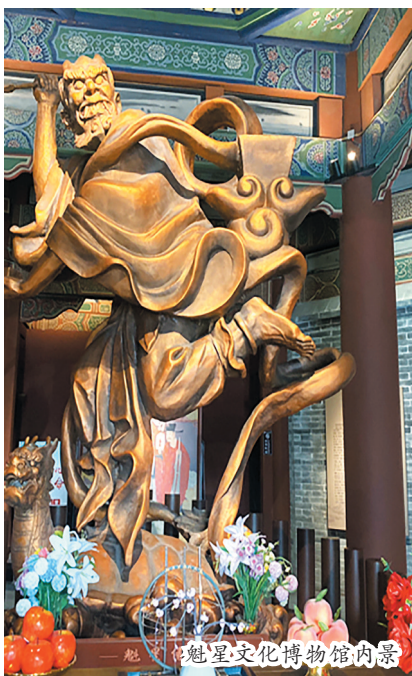
魁星文化博物馆内景

大同市平城区武定街与大十字街交汇处，有一座供奉魁星像的八角五层楼阁，称为“魁星楼”。西邻五龙壁，东邻玄真观，曾为大同县文庙的魁星楼，现为大同市重要标志性建筑。新复建后的魁星楼为楼阁式建筑，底层十字穿心通街，平面呈正八边形，通高31.24米。