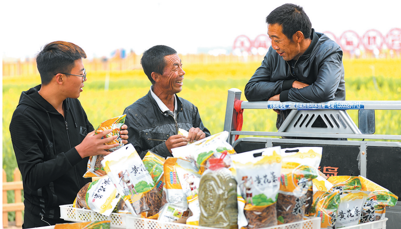
黄花喜获丰收，云州区农民脸上露出欣慰的笑容。