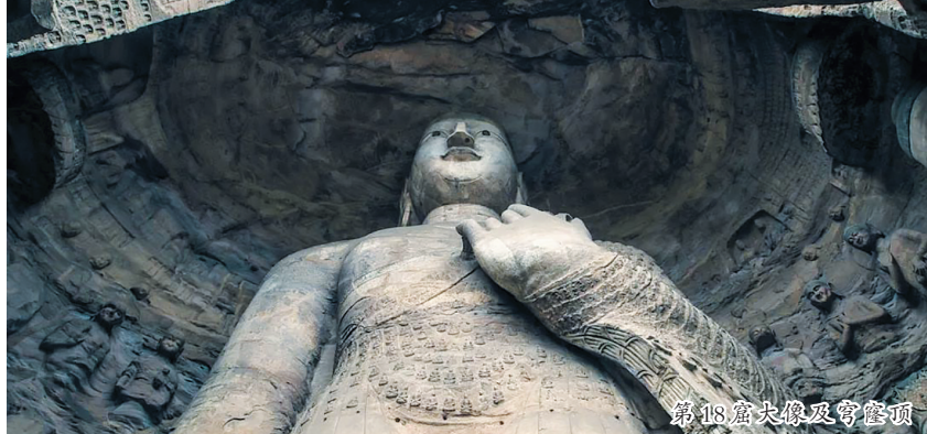
第14窟大像及穹窿顶

拉开序幕。《魏书·释老志》记录了开始凿窟时的情况:“和平初,昙曜白帝,于京城西武州塞,凿山石壁,开窟五所,佛建佛像各一,高者七十尺,次六十尺,雕饰奇伟,冠于一世。”“昙曜五窟”即今云冈石窟中的16-20窟。这是云冈的第一期石窟。 识别要点。1.多大窟。一期石窟都是大洞窟,平面马蹄形、窟顶是穹窿顶,仿印度给教徒修习的草庐形式,一门一窗,外雕千佛。 2.全大像。主像形体高大,面相丰圆,有明显的古印度和凉州风韵,占据了窟内大部分面积,你最熟悉的20窟大佛就高达13.7米。 3.三世佛。一期的造像题材主要是三世佛,五个洞窟的主尊可以分成佛立像、交脚像、佛坐像三种。据说这五尊佛分别代表北魏的五位皇帝。各个洞窟的主尊分别为:第16窟是施无畏印的佛立像,第17窟为交脚菩萨像,第18窟也是佛立像,第19窟是施无畏印的佛坐像,第20窟是施禅定印的佛坐像。