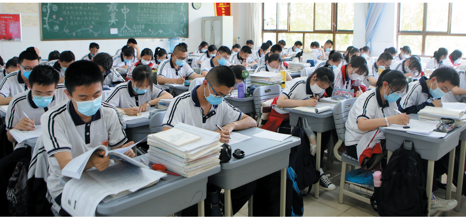
6月1日，大同一中高三学子正在教室内聚精会神地学习。十年磨一剑，六月试锋芒。高考前夕，全市各中学高三师生正以饱满的精神、昂扬的斗志，备战高考。

家庭寄养机制刚刚起步，每户寄养家庭只能发放几斤小米作为孤儿的基本生活经费，勉强维持的口粮都优先给福利院的孤儿，但就是在这样艰苦的条件下，孤残儿童的生存率大幅提高。”市社会福利院负责儿童工作的沈园告诉记者，这一看似简单的形式开创了“家庭寄养”育孤模式的先河。从此，“大同育孤模式”被民政部在全国福利机构广泛推广，“乳娘文化”享誉海内外。后来，随着儿童寄养的需求增多，福利院不断完善工作制度，建立外育孤儿档案，形成了以散岔、解庄、西骆驼坊、上榆涧、唐家堡为中心的4区2县15个乡镇38个村200多个家庭的辐射育孤网络。