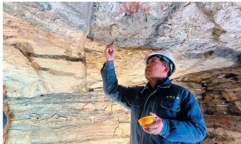
云冈研究院文保人员对石窟病害进行调查分析

本报讯（记者 赵喜洋）根据《科技部中央宣传部中国科协关于举办2022年全国科技活动周的通知》及山西省科技活动周相关指示精神，云冈研究院于日前举办了“走进科技，你我同行——揭秘文保科技，传承工匠精神”线上直播活动。