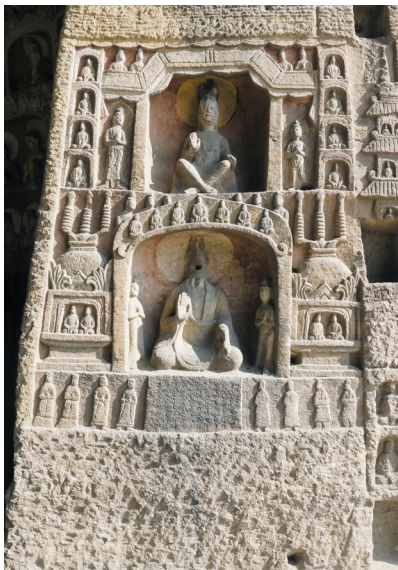
《太和十九年妻周氏为亡夫造像记》掠影