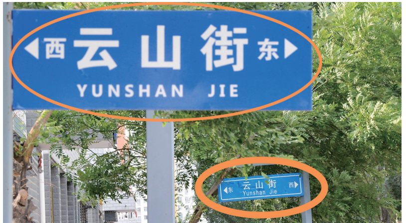
在云山街与文兴路交叉口,一块标有“云山街”的道路指示牌东西方向颠倒。