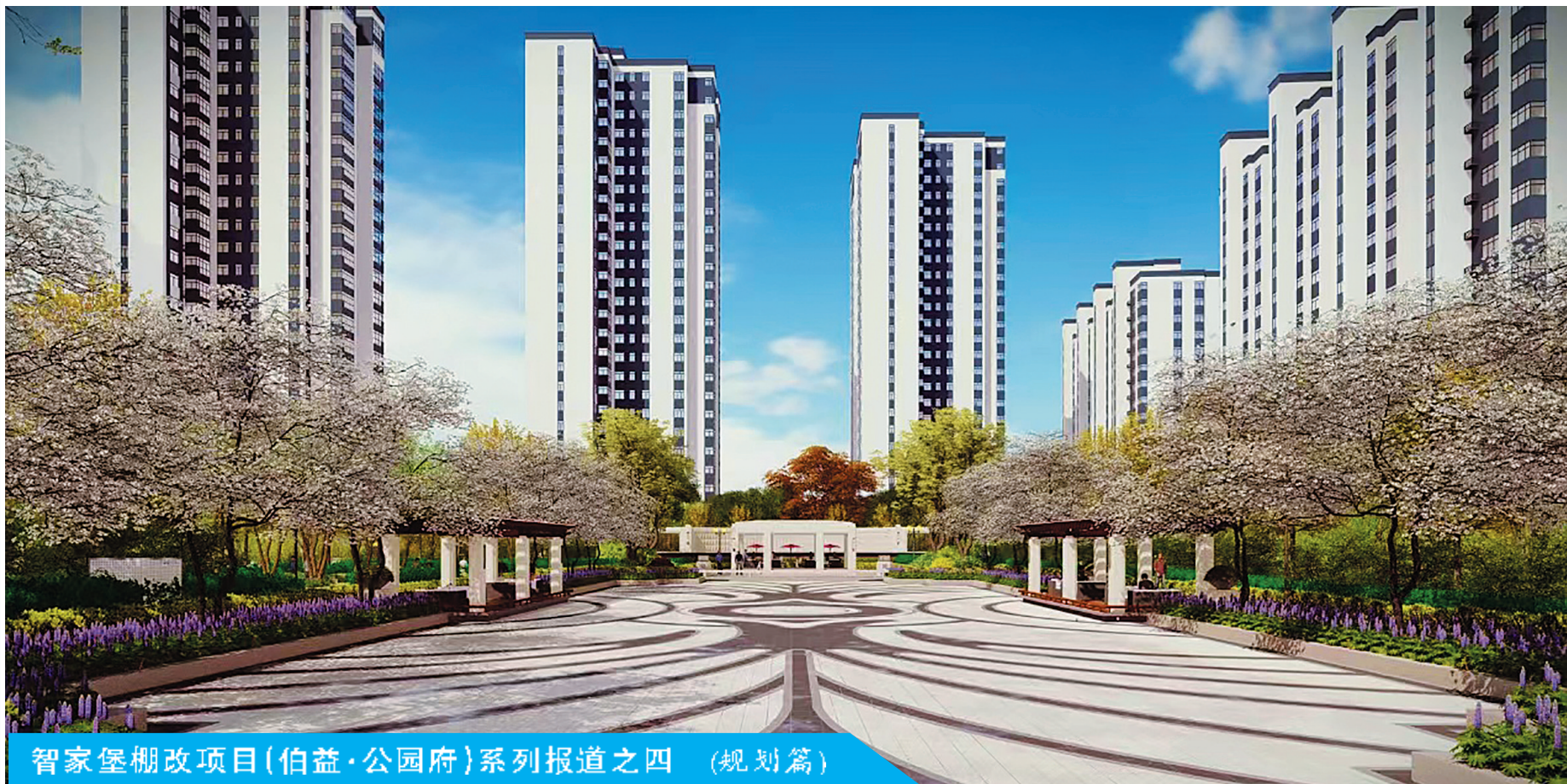
智家堡棚改项目(伯益·公园府)系列报道之四 (规划篇)