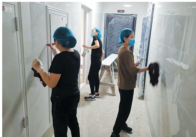
图为悦家物业工作人员正在清理墙壁污渍

目前,开源·金懋府交付已经进入倒计时阶段,为给业主呈现一个干净、舒适、温馨的家园,也为保障后期物业服务品质,悦家物业组织全体员工对该小区进行集中开荒保洁工作。