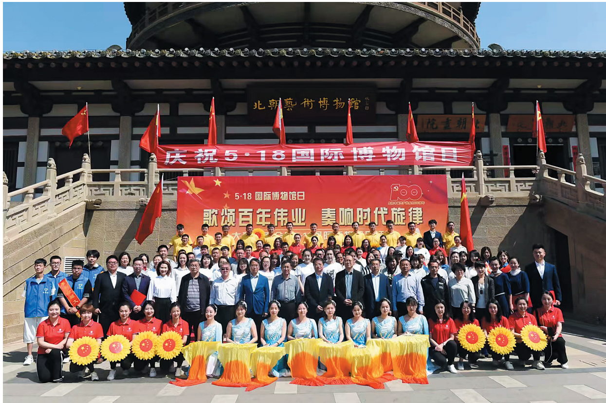
优秀的大同市博物馆团队

2022年,荣获由人力资源和社会保障部、国家文物局颁发的“全国文物系统先进集体”荣誉证书。