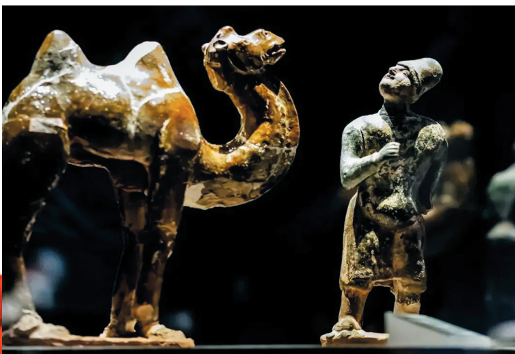
司马金龙墓出土的胡人牵驼俑