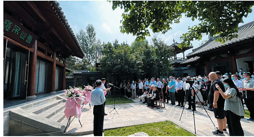
“宿白先生纪念馆”开幕式现场