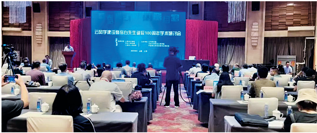
云冈学建设暨宿白先生诞辰100周年学术研讨会现场