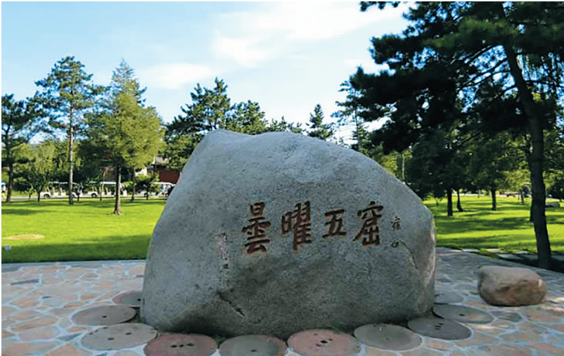
宿白先生题写的“昙曜五窟”