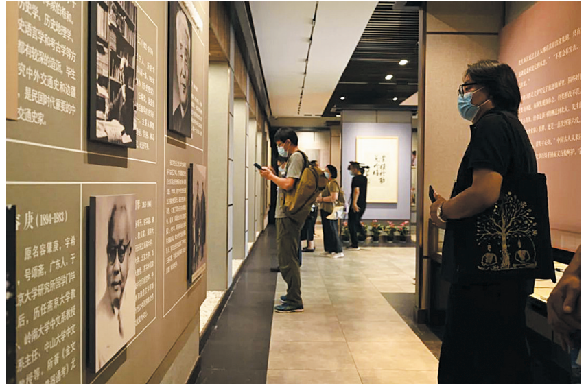
游客参观宿白先生纪念馆

8月的云冈，万木葱郁，游人如织。3日上午，由山西省文物局、大同市委市政府指导，云冈研究院、北京大学考古文博学院、中国考古学宗教考古专业委员会联合主办的“云冈学建设暨宿白先生诞辰100周年学术研讨会”在云冈研究院召开。