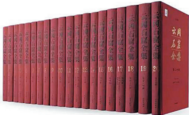
20卷本《云冈石窟全集》

学签署合作框架协议。 7月，《云冈石窟全集》荣获“第五届中国出版图书政府奖”。 7月，《圣地重新——云冈百年复兴展》入选国家文物局2021年度“弘扬优秀传统文化、培育社会主义核心价值观”重点推介项目。 8月24日，云冈石窟第19窟数字化信息采集工作完成。 10月12日，“文物保护与科技创新”院士论坛召开。 10月12日，云冈研究院被授予“石窟文物保护与研究山西省文物局科研基地”和“石窟寺保护与传承山西省重点实验室”。 10月27日，“中国与世界特展”入选2021年度山西省主题展览征集重点推荐项目。 11月12日，云冈石窟第1-4窟危岩体加固及防排水工程竣工。 11月14日，“第二届云冈学论坛”召开。 12月，《云冈石窟山前佛教寺院遗址发掘报告》（全三册）出版。 12月14日，云冈石窟申遗成功20周年座谈会召开。 12月14日，“纪念云冈石窟成功申报世界文化遗产20周年暨第三届山西石窟考古田野工作坊石窟测绘专题研讨会”召开。 12月，云冈研究院被教育部列为