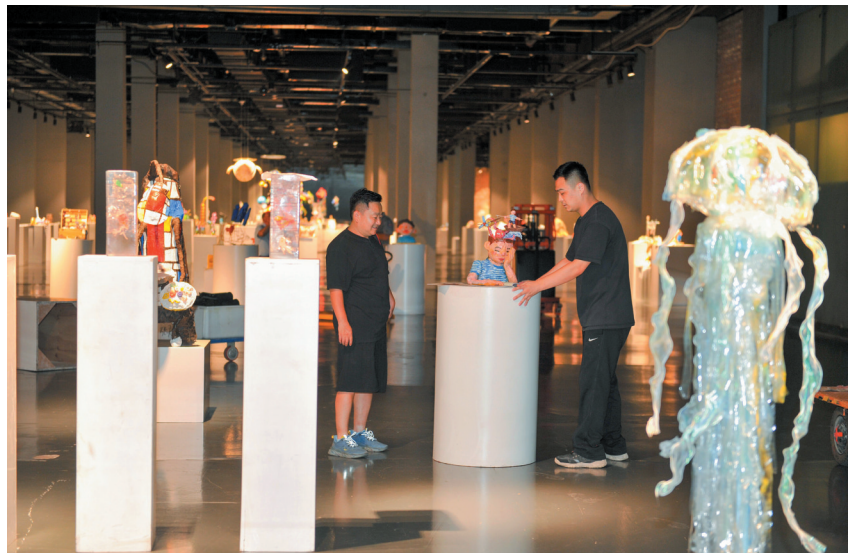
8月6日，市雕塑博物馆内，第五届青少年雕塑作品展览布展人员正在加紧布置灯光、摆放雕塑作品。据了解，2022第五届青少年雕塑作品展览将于8月9日至9月16日在市雕塑博物馆展出。本次展览共收到来自北京、上海、广州、深圳等100多个城市2973位青少年的来稿，报送4866件（组）作品。