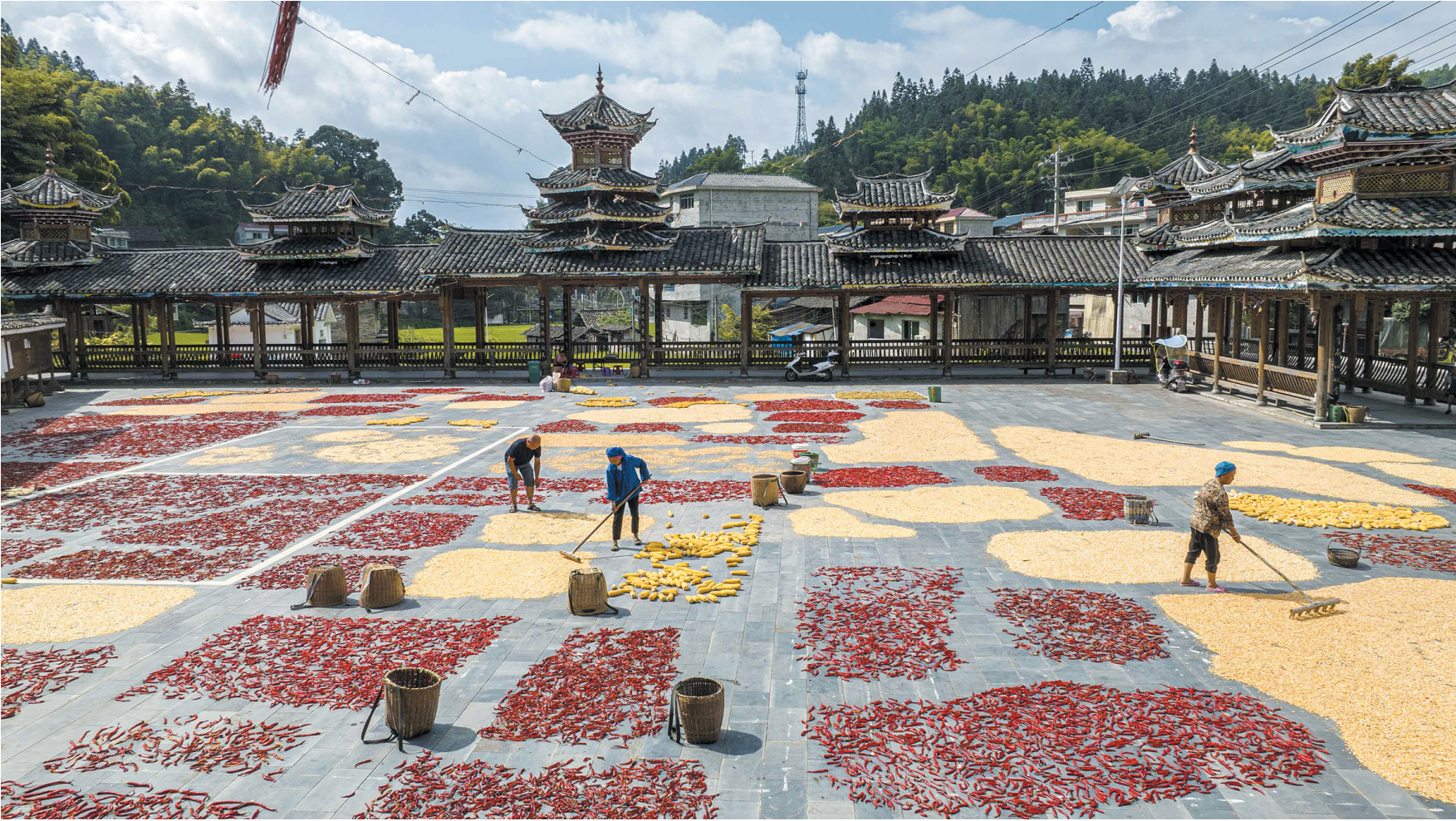
8月14日，贵州省黔东南苗族侗族自治州锦屏县大同乡秀洞村村民在晾晒农作物（无人机照片）。立秋过后，贵州高原乡村处处晒秋忙。玉米、辣椒、稻谷、黄豆等农作物晾晒在农家房前屋后，与周围别具特色的田园风光融为一体，绘就出一幅幅美丽的丰收图景。