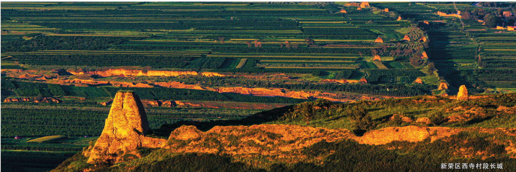
新荣区西寺村段长城