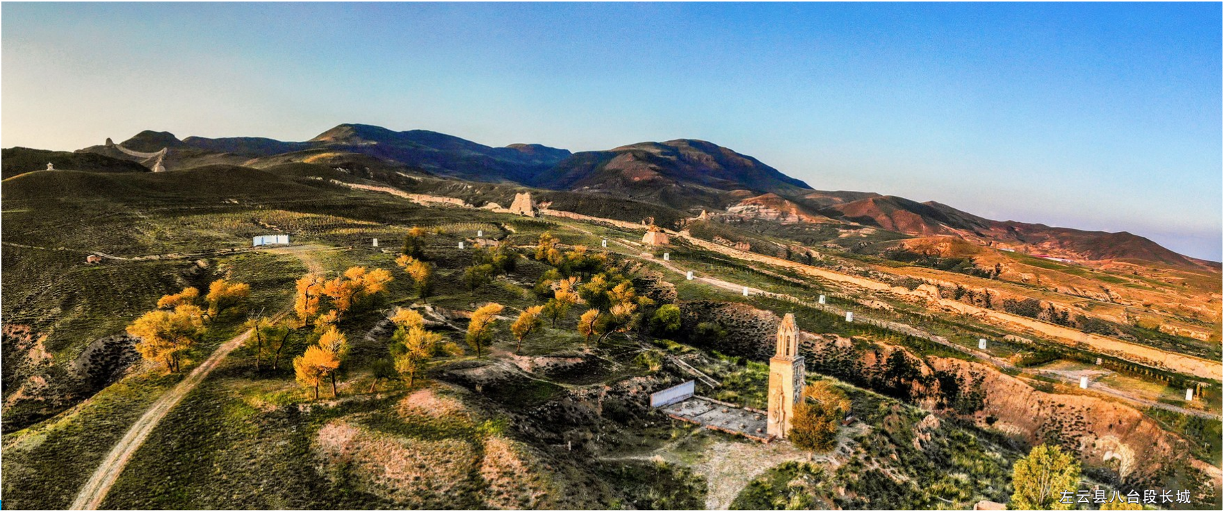
左云县八台段长城