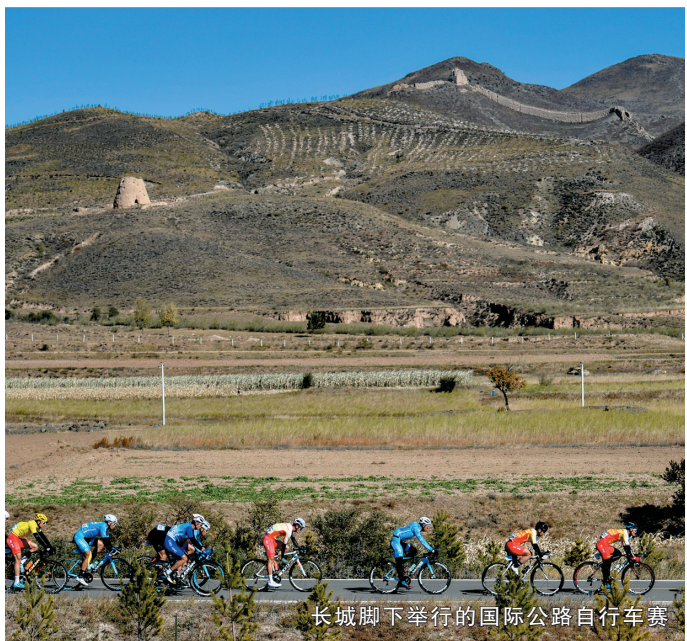
长城脚下举行的国际公路自行车赛