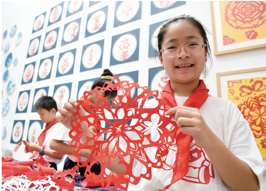
合肥：多彩假期展才艺

以5G和千兆光网为代表的“双千兆”网络,具有超大带宽、超低时延、先进可靠等特征,是新型基础设施的重要组成部分和承载底座。按照党中央、国务院决策部署,工信部会同有关部门出台一系列政策文件,大力部署推进5G和千兆光网建设应用。