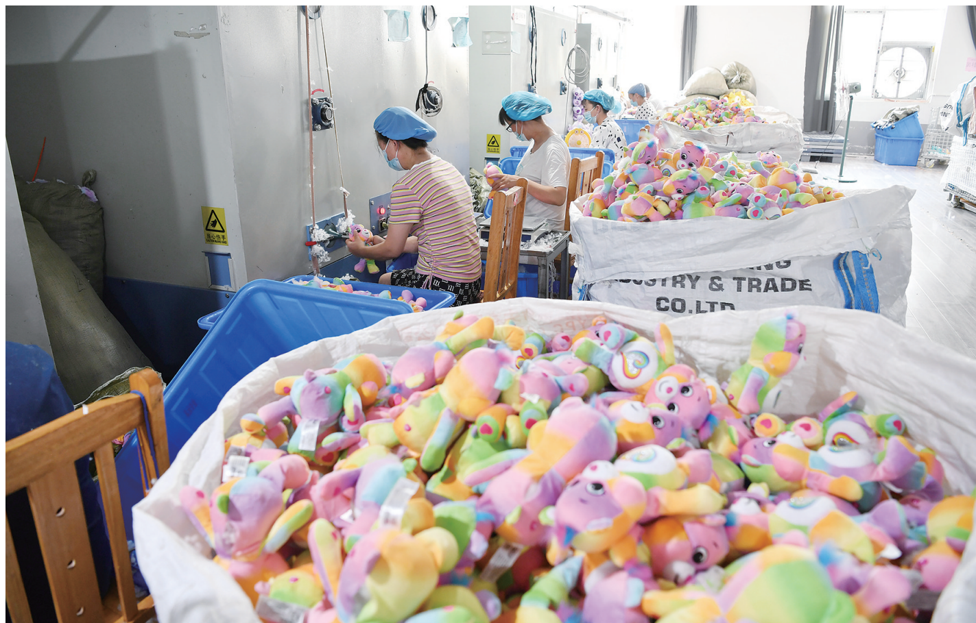
在安康市恒口示范区一家毛绒玩具生产企业车间内，工人在填充毛绒玩具（2022年8月18日摄）。

营商环境，增强企业投资信心，推动项目建设不断取得实效。下一步，将认真贯彻落实本次会议精神，紧扣项目“谋划、引进、建设、投产、达效”五个环节，强力推行“全产业谋划、全链条布局、全要素保障、全方位服务、全员化招商”五项具体措施，认真做好项目“规划入围、可研立项、资金筹措、安全保障、质量控制”五个方面工作，推动重点项目谋划和建设工作有序有力有效开展，取得新的更大的成效，确保年度目标任务圆满完成，向省委、省政府交上一份满意答卷。