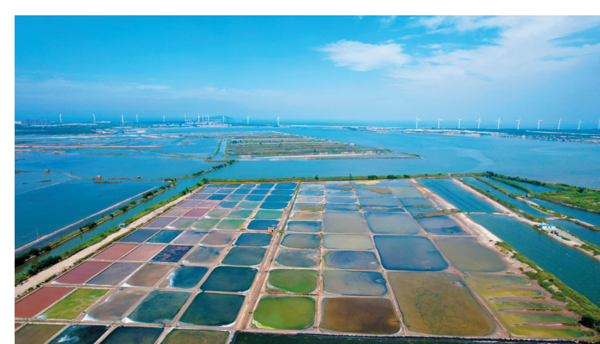
这是8月26日拍摄的山东省荣成市港西镇海边的一处盐田（无人机照片）。初秋时节，山东省荣成市港西镇海边的盐田在晴空下五彩斑斓。

证，做大、做强、做实综合行政执法队。今年以来，已有3名干部取得了执法资格证，5名干部入围执法考试复试。 细化清单，明确执法权责。规范制定了《花园屯镇综合行政执法队行政执法事项清单》。通过“依法授权一批、照单赋权一批、按需委托一批”方式，全面明确乡镇承担的行政检查、行政处罚、行政强制事项等法定行政执法权力事项60项。精准划分设定依据，全面推行清单化作业，明确每项权限名称、依据、工作流程和监督方式等，让乡镇执法“看得见、管得着、用得好”。积极加强与区级有关部门的沟通联系、互通信息，逐步探索建立综合执法信息资源共享，对相关行政处罚、行政强制措施等监管情况实行信息资源共享，确保执法工作权责明确、精准到位。 加强培训，提高执法能力。今年7月，组织全镇执法队员及相关工作人员召开专题培训会，邀请该镇司法所所长，围绕乡镇综合行政执法工作实际，以《行政处罚法》为重点，结合行政执法事项清单、行政执法程序规定、委托执法事项等内容，采取经验传授、案例教学、现场讨论等方法，对乡镇综合行政执法改革政策要求、具体业务进行了系统化培训学习，进一步解决了执法队做什么、怎么做的问题。不断推进综合行政执法规范化建设，创新执法方式，依法执法、严格执法、科学执法、文明执法，确保权力放得下、接得住、管得好、有监督。（下转第二版）