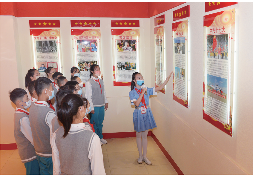
图为平城区14校组织学生在该校“党史红色展馆”开展党史教育。