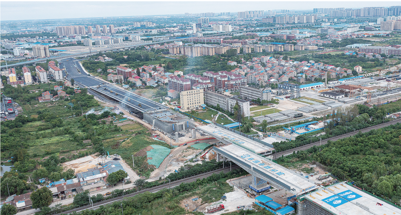
8月30日，湖北孝感跨京广铁路的桥梁成功转体（无人机照片）。当日，由中铁七局承建的湖北省孝感市孝云大道长兴三路延伸工程跨京广铁路的两座万吨桥梁成功转体。每座转体桥梁长114米，宽20.5米，重量约为1万吨。施工过程中，建设人员抢抓铁路运行“天窗点”，运用信息技术平台，对转体过程进行实时跟踪，确保万吨重的梁体安全平稳转体，同时最大程度减少对铁路线的干扰。

镇密切关注天气变化、备足防汛物资，全力加强防守值守，保持高度警惕，严阵以待做好防汛各项工作。同时，加大隐患排查力度，紧盯河道、危房和蓄水池等重点区域，划分防汛工作责任区，健全网格管理。利用村大喇叭、微信群等多种方式及时发布气象信息，开展防灾减灾宣传，进一步提升群众抗灾自救能力，形成共同抓好防汛工作的强大合力，全力构筑防汛“安全堤”。