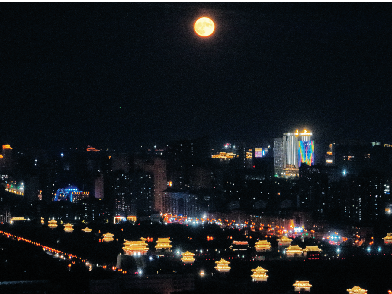
又是一年中秋至,这一天人们赏月、吃月饼、谈天说地,畅聊家常,尽享天伦之乐。图为大同古城月夜美景。

市工信局希望云冈区政府认真完善落实创建方案,创新工作思路,采取有力措施,创造一批可复制推广的经验亮点,打造成为全省中小企业高质量发展的示范标杆,促进当地县域经济发展和全市中小企业高质量发展。