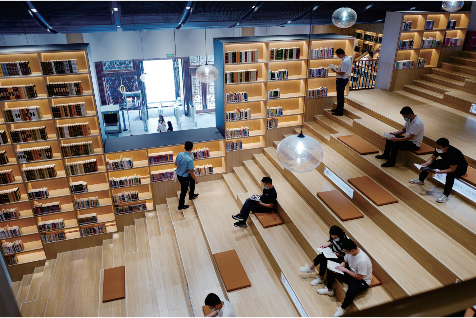
9月30日，读者在江北区图书馆鸿恩寺馆内阅读图书。 当日，重庆市森林中的公共图书馆——江北区图书馆鸿恩寺馆正式开馆投入运营。鸿恩寺馆坐落在鸿恩寺森林公园内，总建筑面积约6500平方米，馆内设置阅览席位1200余个，含有报刊阅览区等10余个免费开放阅读区域。据介绍，江北区图书馆鸿恩寺馆是一座传统图书馆与数字图书馆相结合的新型现代化图书馆，馆藏文献总量40余万册，其中纸质图书15万册，电子图书近27万册，期刊近400种。

市交通车体、建筑围挡、公共场所、生活小区等载体投放“清廉大同”公益广告。全方位立体式的宣传报道，提高了社会各界对“清廉大同”品牌的认知度。 阵地创建实体化，立体式构建廉政教育体系。全力打造廉洁文化“一区一品”。在全市11个区县开展廉洁文化创建活动，共建灵丘县平型关红色革命教育阵地圈、左云县清风林沉浸式红色教育、天镇县“长城+红色”廉政教育、新荣区廉洁文化场所培育等一批廉洁文化教育功能明显的阵地网络，在全社会营造崇廉风尚。构建“2+10+N”廉政教育阵地网络，依托市党风廉政教育馆、大同红色记忆馆2个主阵地，聚合全市10个廉政文化示范点和多个党纪教育基地，把分散在各区域的廉洁教育资源纳入全市廉政教育范畴，绘制廉政教育阵地地图，让廉洁教育“活”起来。主题活动期间，全市累计10万人次接受廉政专题教育，持续强化对党员干部的廉洁教育和引领，形成尊崇廉尚廉的廉洁文化氛围。